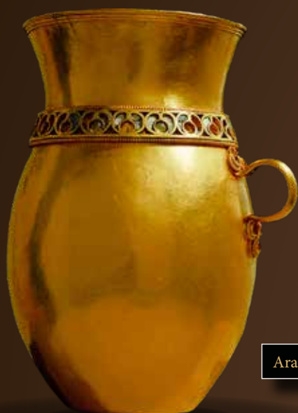
Aranyból készült edény a kunbáonyi sírból

Fontos adatokkal szolgálnak a fenti sírok környezetében előkerült igen gazdag aranyleletes temetők és a számos szórvány aranytárgy is. Az ott eltemetettek (illetve a szórványleletek egykori tulajdonosai) bizonyosan az aktuális uralkodócsalád udvartartásához tartoztak. Vonatkozik ez különösen a kimagasló gazdagságú nőkre, hiszen az előkelő avar hölgyeket közösségük temetőjében helyezték nyugalomra; magányos eltemetésük – ellentétben a honfoglaló és a kun hagyományokkal – nem volt szokás az avarok körében.