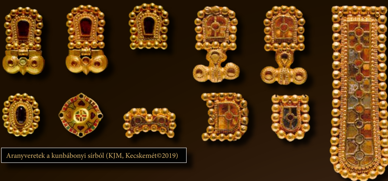
Aranyveretek a kunbáonyi sírból

a bócsai nagyúr védelmében láthatott el fontos szerepet az aranyveretes kardos keceli harcos is.