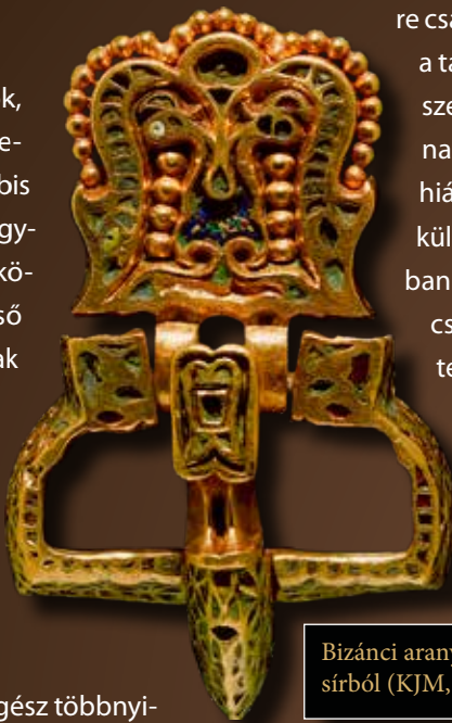
Bizánci aranycsat a kunbábonyi sírból

Természetesen a hatalom csúcsán levők, akiknek régészeti hagyatéka – még töredékében is – uralkodóhoz, de legalábbis az uralkodócsalád tagjaihoz méltó. A nagyurakat soha nem családjuk, szűkebb közösségük temetőjében helyezték végső nyugalomra, hanem egy különleges, csak nekik járó „sírkertben”, feltehetően valahol a birtokuk egy jól védhető részén – és szükség is volt erre a védelemre. Hiszen az életükben kijáró pompa elkísérte őket halálukban is, amire a ránk maradt tárgyak sajnos csak utalhatnak. Magányos sírjaik ugyanis mindig véletlenszerűen kerültek elő; régész többnyi-