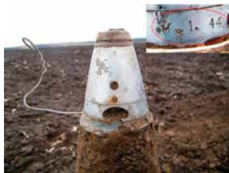
A repeszgránát 1933 M gyújtója. A gyújtó oldalán látható jelzések a gyártás helyét (Magyar Királyi Állami Vas-, Acél- és Gépgyár, Diósgyőr /MÁVAG/, Vadásztöltény-, Gyutacs- és Fémárugár Rt., magyaróvári gyára), a szériaszámot (1) és a gyártási évet (1944) adják meg