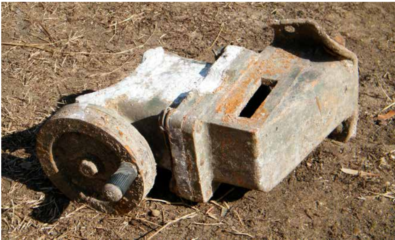
A feltételezhetően találat érte magyar 1929/38 M 8 cm-es löveg irányzóberendezésének maradványa, az oldal előretartás kézi kerekével

A 118–121 m-es tengerszint feletti magassággal rendelkező, megközelítőleg 0,8 hektáros kiterjedésű kutatási területen intenzív leletmintázatot találtunk: nagy számban kerültek elő szovjet BM–13 „katyusa” sorozatvető rakétalövedékek maradványai és egyéb repeszek. A vizsgált terület két részén is találtunk robbanótesteket; a lövedékeket a helyi lakosság a frontvonal elhaladtá-