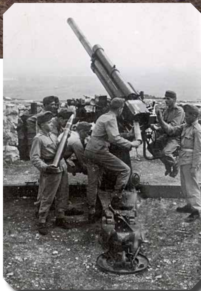
Magyar 1929/38 M 8 cm-es löveg tüzelőállásban

Civil bejelentést követően a Magyar Honvédség (MH) I. Honvéd Tűzszerész és Hadihajós Ezred tűzszerészei 2016. december 3-án a Fejér megyei Sáregeresnél lőszermentesítést hajtottak végre. A település délnyugati külterületén levő, mezőgazdasági művelés alatt álló ingatlan területén ugyanis szántás során második világháborús robbanótestek kerültek napvilágra. Az előkerült lövedékek közelében a tűzszerészek egy magyar 1929/38 M 8 cm-es légvédelmi löveg jól beazonosítható maradványait (az irányzóberendezés részét és a szekrény lövegtalp egyik alátétlemezt) is megtalálták. A lelőhelyen később, a szükséges engedélyek birtokában a Honvédelmi Minisztérium Hadtörténeti Intézet és Múzeum végzett fémkereső műszeres terepbejárást.