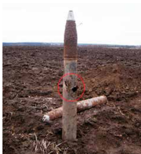
Előtalált magyar 1929/33 M repeszgránáttöltény (elől), 1929/32 M légvédelmirepszgránát-töltény (hátsó). A repeszgránát hüvelyén jól láthatóak a repesztalálat nyomai