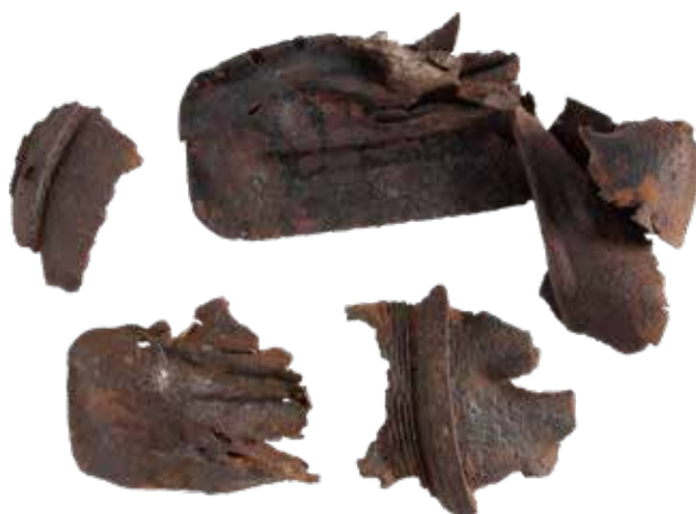
Szovjet BM-13 „katyusa” rakétalövedékek maradványai