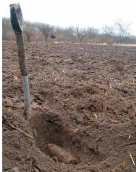
Előtalált magyar 1929/35 M 8 cm-es páncéltörő gránát