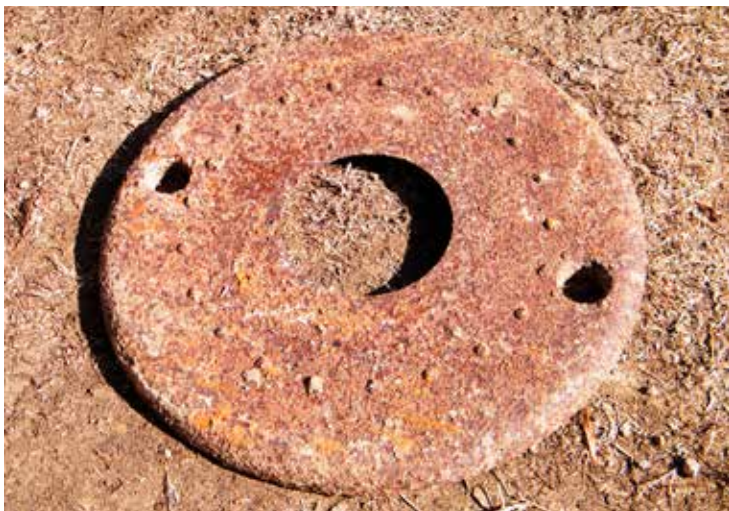
A szekrény löveg talp egyik alátétlemeze