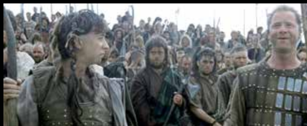
A jobb oldali skót coat of plates en jól látszanak az öletszerűen felszegecsett „páncéllemezek”