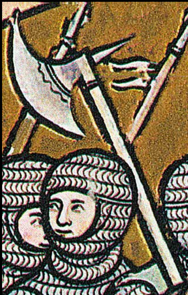
A Maciejowski biblia csatabárd-ábrázolása