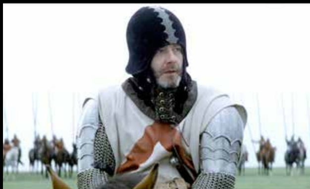
A szövetborítású és fémpáncéllal díszített darab kivitele a 15. század végi itáliai dísz barbuta sisakokra emlékeztet, de a hozzáálmodott csuklya szintén fantáziadarab