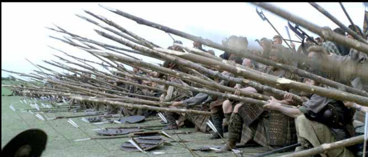
A rögtönzött „sündisznóállás”, mely a filmben eldöntötte a stirlingi csata sorsát. Valójában Wallace mesteri húzással, egy hídon történő folyóátkelés közben rohanta meg az angolokat a lándzsáival, akik így nem tudták érvényesíteni létszámfölényüket