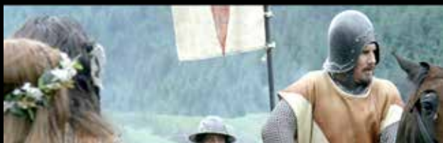
A bascinet sisak némileg hasonlít az eredetike, de a korban nem használták