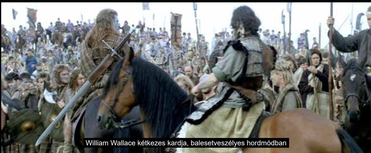
William Wallace kétkezes kardja, balesetveszélyes hordmódban