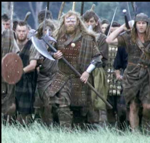
Hamish Campbell és csatabárdja

Szólni kell még Sir William Wallace nagy méretű kardjáról, mely a film végére Wallace jelképévé is vált. Wallace-t a köréje fonódó mondanakör egy hatalmas erejű harcosként örökítette meg, aki óriási, két kézzel forgatott kardjával aprította az ellenséget. A rendező nyilván ennek a legendának akart megfelelni, ezért adták a főhős kezébe ezt a hadieszközt. Az tény, hogy őriznek egy kétkezes kardot a Nemzeti Wallace Emlékműben is, amelyet magának, Wallace-nak tulajdonítanak. A fegyvertörténi kutatások azonban mára tisztázták, hogy a fegyver valójában egy kései, 16. századi darab, tehát Sir William ezzel semmiképp sem harcolhatott a csatáiban. De azért sem, mert a kétkezes kardok igazából csak a 16. század elején jöttek használatba, ráadásul nem a háton hordták őket, mint a filmben, hanem a vállon. A filmbéli háton hordás igen célszerűtlen lett volna a lovon is, hiszen a csupasz penge állandóan ütötte volna a hátast futás közben pedig könnyen a lába közé akadhatott volna a használójának.