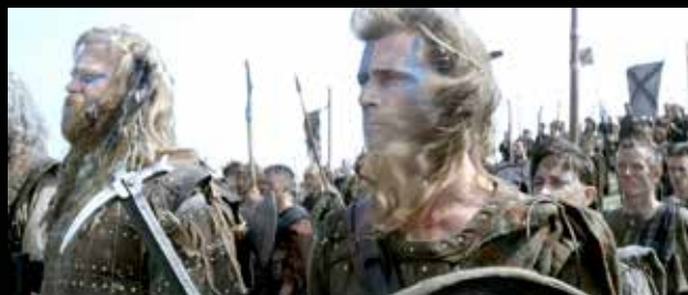
A kétszáz évvel később használatos csatacsákány

A képen számos különböző típusú szálfelegyver látható, a horoggal ellátott alabárdokat illeték a Jedburgh staff vagy Lochaber axe elnevezéssel. A képen a balról a negyedik szálfelegyver, egy hosszúhegyű alabárd a 16. század második felében használt eszközökhöz hasonlít