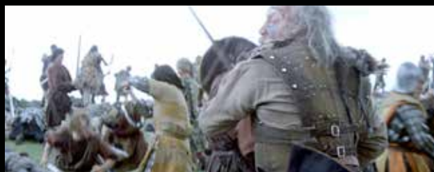
A skót coat of plates rögzítése a háton