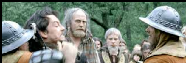
A bográcssisakokon jól látszik, hogy nem kovács munkái