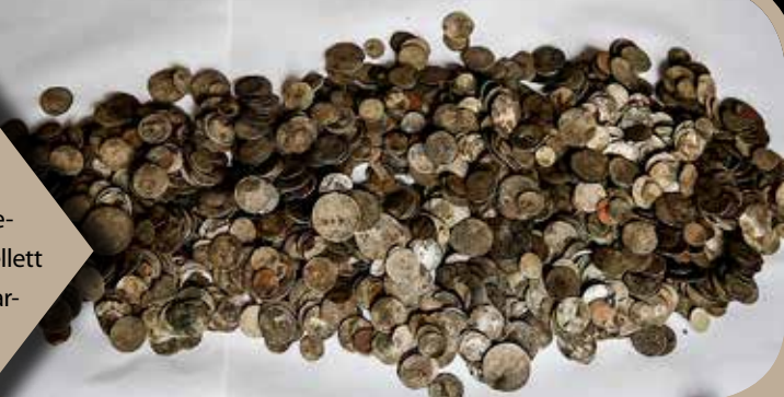
Kincsek a Dunából

2018-ban a Duna vízszintje jóval alacsonyabb volt a sokéves átlagnál, Érdnél a víz mintegy 10 méterrel húzódott vissza. A korábban vízzel borított területen egy leletbejelentés után a szentendrei múzeum munkatársai több ezer leletet gyűjtöttek össze. Az ezüst- és aranypénzek mellett fegyverek, ágyúgolyó, sarkantyú és egy hajóhoz tartozó leletek kerültek elő, például kolomp, hajószögek. A leletek a 17–18. századból származnak és valószínűleg egy, a 18. században elsüllyedt hajó felszereléséhez és rakományához tartoztak.