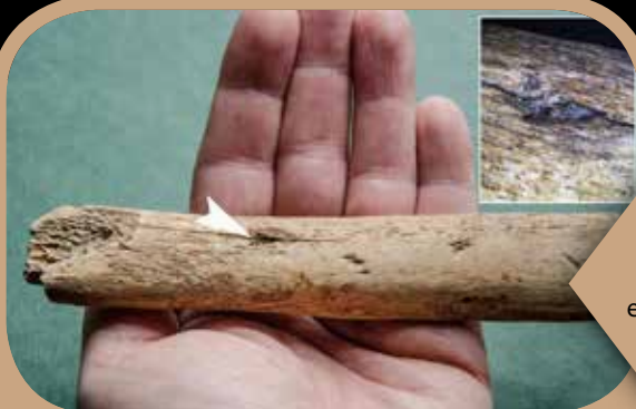
Beletört a „bicskájuk”

Krakkó városában (Lengyelország) a Hofman utca környéke rejt az egyik legnagyobb európai mamutlelőhelyet. Az 1967 óta folyó kutatások során eddig mintegy 110 példány csontjai kerültek elő, melyek kb. 25.000 évesek. A csontok elemzése során egy pattintott penge darabját találták meg egy mamut egyik bordájába ékelődve. A mintegy 7 mm hosszú töredék egy nyílhegy, vagy ami még valószínűbb, egy dárdahegy része lehetett. Ez a sebesülés közvetlenül nem volt halálos, valószínűleg további sérülések okozhatták az állat pusztulását. Ez a lelet az első olyan direkt bizonyíték Európában, ami a jégkori mamutok vadászati módjára utal, eddig hasonló leletek csak Szibériából voltak ismertek.