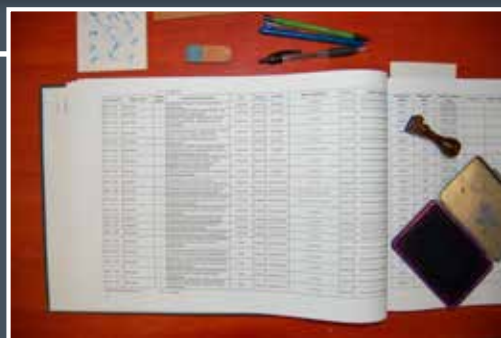
Régészeti leltárkönyv és revíziós pecsét