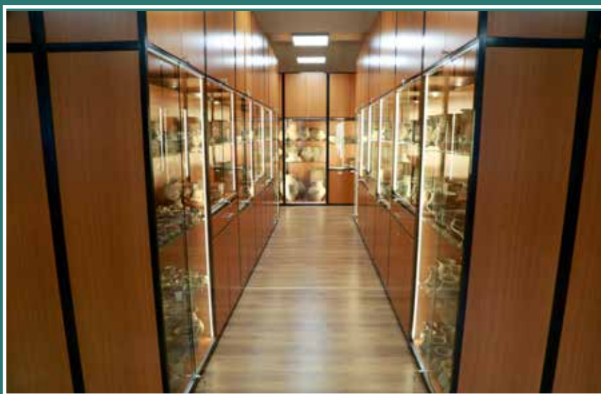
Régészeti látványraktár, Móra Ferenc Múzeum

A műtárgyszállítások – úgy a múzeumon belüli, mint azon kívüli –, műtárgymozgatások esetén adminisztratív feladatokat végez, de csomagolja is a műtárgyakat, és ellenőrzi a biztonságos szállításukat. Munkájára leginkább az önálló munkavégzés jellemző, de tevékenysége során szükséges, hogy a műtárgyvédlem területén dolgozókkal is folyamatos munkakapcsolatban álljon. Könnyedén kell eligazodnia a múzeumi raktárban elhelyezett műtárgyak között, a nyilvántartás alapján meg kell találnia a pontos raktári lelőhelyet, legyen szó körömnymi nagyságú, apró