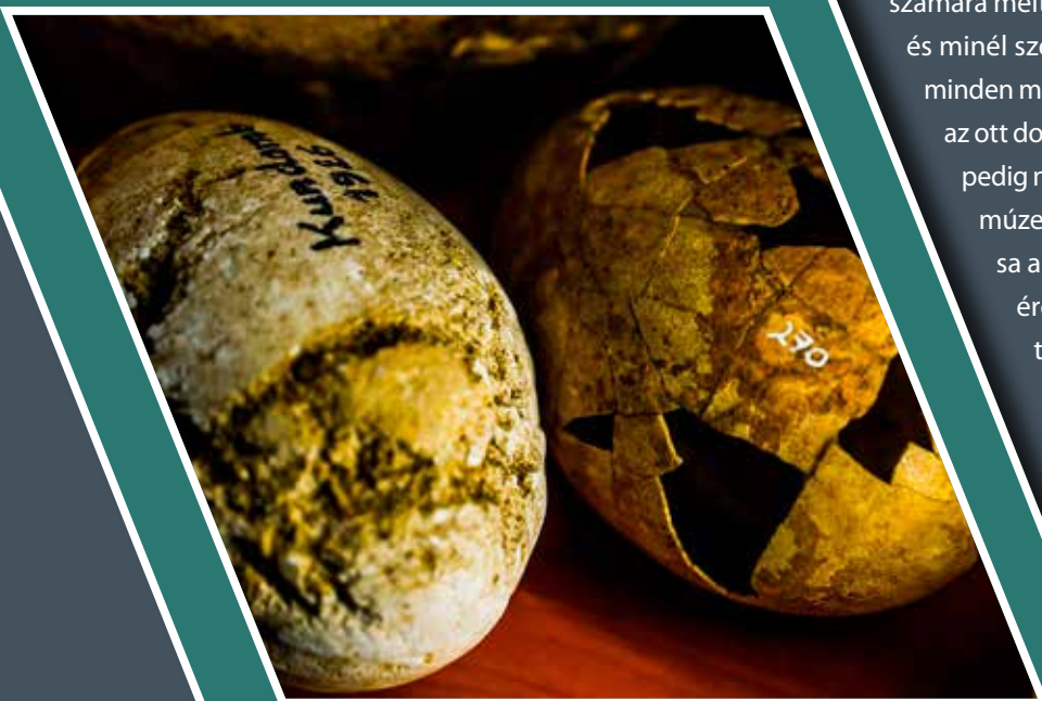
Avar kori tojások a kundombi és a kiszombori temetőből (Móra Ferenc ásatása)