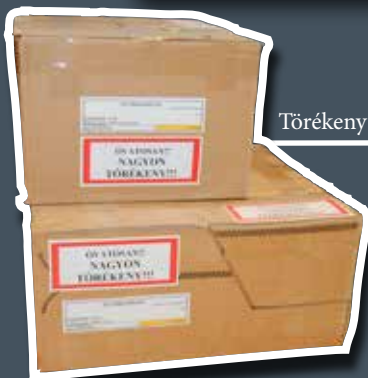
Törékeny leletek dobozai külön jelölésekkel ellátva