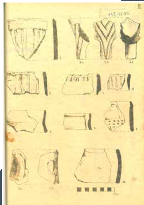
Adatári dokumentum régészeti leletek rajzaival

a polcrendszerutatók, valamint a leíró- és mutatókarton-rendszerek segítik. Mindez ma már persze számítógépen rögzített adatbázis, ami lényegesen megkönnyíti a visszakeresést. A gyűjteményi mozgásokat, például egy kiállításba kikerülő, kölcsönzésre kiemelt tárgyat a „mozgási naplóban”, kölcsönzési jegyzékek szerint tartjuk nyilván. A kivett műtárgyak helyére hiányjelző kartonok kerülnek, melyeken a tárgy leltári száma, megnevezése, darabszáma mellett az is szerepel, hogy ki, mikor és milyen céllal emelte ki az adott leletet.