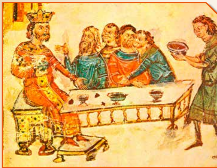
Krum bolgár kán (803–814) 14. századi ábrázolása a Manassész-krónikában

zat csomópontjaira is. Az avar korban már kialakultak a somogyi kohótelepek, amelyek a legújabb kutatások alapján a korai Árpád-korban is folytatták a termelést. Az Erdélyi-medencében az avar korban valószínűleg már termelés alá vont sólelőhelyek indokolhatták a magyar megtelepedést. E nyersanyagok szál-