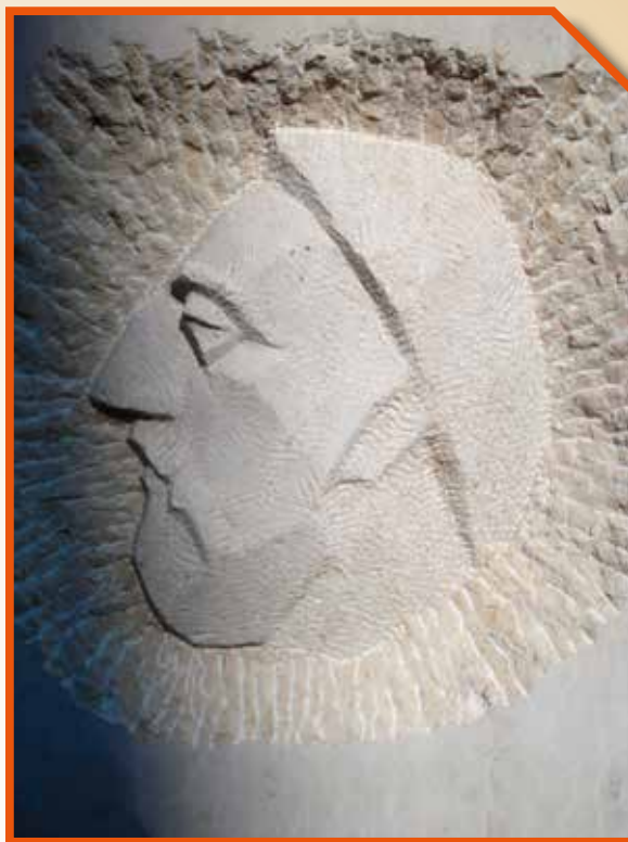
Borna dux emlékműve Horvátországban

Mindezek alapján valószínű, hogy a több kutató által a mai napig a Karoling hadjáratokig, 800–810-ig keltezett avar régészeti leletanyag való-