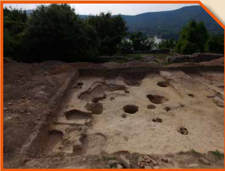
A Visegrád-Sibrik-domb lelőhely feltárása (Merva Szabina ásátása)

(C14) keltezésekkel lehet, amelyekből sajnos az avar korra vonatkozóan még csupán alig néhányal rendelkezünk.