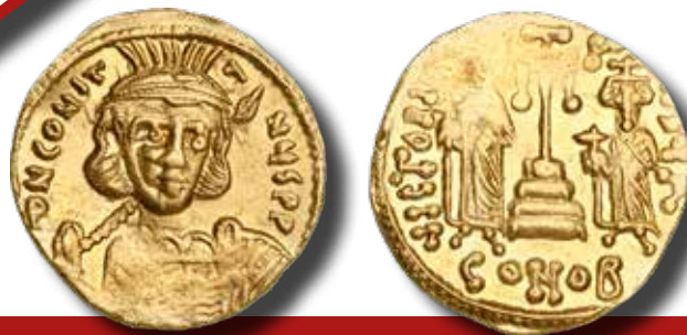
4. kép: IV. Constantinus 669 és 674 között vert solidusa (átmérő: 19 mm, súly: 4,20 g) a konstantinápolyi verde 1. műhelyéből

árjában jelent meg Konstantinápolyban. A Kaukázustól északra elterülő sztyeppre akkortájt érkezett ázsiai eredetű avarokkal a császár úgy egyezett meg, hogy ajándékok fejében féken tartják a Fekete-tenger mellékén élő és a birodalom balkáni provinciáiba be-betörő, azokat pusztító népeket. A megbízás teljesítése során az avarok annyira lendületbe jöttek, hogy 568-ban már a Kárpát-medence urai, s egyúttal Bizánc kéretlen szomszédai lettek. Erre föl az időközben elhunyt I. Iustinianust a trónon követő II. Iustinus császár rögtön felmondta a tíz évvel koráb-