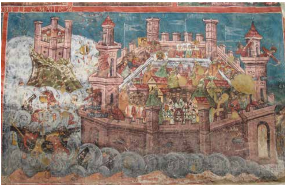
8. kép: Konstantinápoly ostroma egy kolostor falfestményén

sát (6. kép), ezért a fentiek értelmében nem lehet kétséges, hogy az avarokhoz került aranypénzek elsődleges forrása 625-ig valóban a bizánci évjáradékok solidusokban kifizetett része volt.