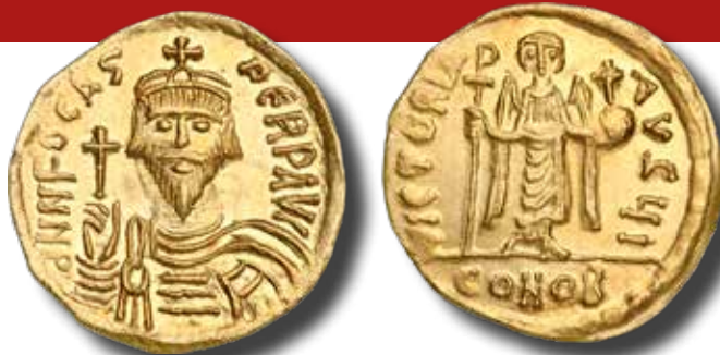
3. kép: Focas 607 és 610 között vert solidusa (átmérő: 21 mm, súly: 4,43 g) a konstantinápolyi verde 10. műhelyéből

Ebben az időben minden gentilis uralom alapja a felhalmozott kincs volt, amelyből az uralkodót támogató elit megkapta a mindenkor neki járó részt. A kincstár rendszeres feltöltése az uralkodók elemi érdeke volt, mert jól tudták, hogy annak elvesztése vagy ki-