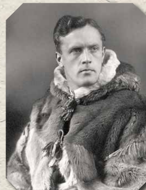
Helge Ingstad 1932-ben

A norvég Helge Ingstad a világon mindenhol arról ismert, hogy régész feleségével, Anne Stinevel együtt tárták fel az észak-amerikai viking telepeket, amely területet a sagairodalom csak Vinland ként ismer. Helge Ingstad hosszú és igen színes életet élt: jogi doktorátussal antropológiai és régészeti kutatásokat végzett, miközben több alkalommal a norvég kormány hivatalnokaként képviselte országát a hideg, kopár északi tájakon. Számos könyvben örökítette meg kutatásait és az arktikus élet szépségeit, annak nehézségeivel együtt.