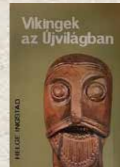
Leghíresebb kötetének magyar kiadása

Svalbard azért is volt jelentős a hidegháború során, mert a szigeteken mind norvég, mind pedig orosz települések is léteztek. A szovjet állam nemzetközi szerződés értelmében szénbányákat üzemeltetett itt. Egy feljegyzésében Helge Ingstad arról a tényről is beszámol, hogy a norvég és a brit titkosszolgálat megpróbálta beszerezni, hogy a helyi szovjet-orosz lakosság ellen kémkedjen.