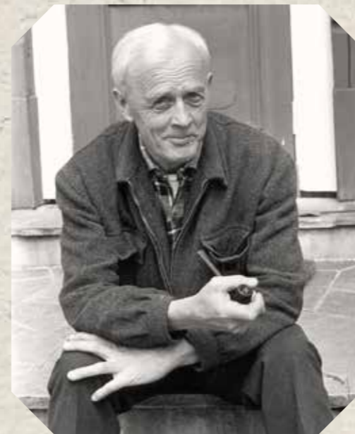
Az idős Helge Ingstad

1951-ben adta ki nagyszerű munkáját, a Nu-namiut. Alaszka eszkimói között című művét. Feleségével 1953-ban Grönlandra utazott, hogy az ottani viking telepeket kutassa. Míg felesége a ré-