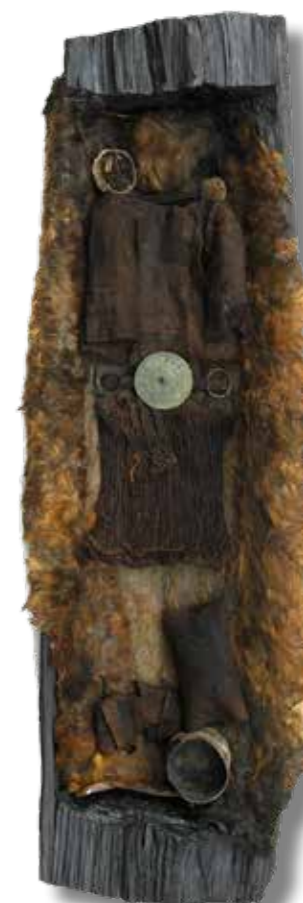
Az egtvedi temetkezés

A Kárpát-medencei késő bronzkor szempontjából is jelentős leletegyüttesnek számít a kostræde-i bronzkincs (Kr. e. 1000–900). Ebben egy fibula, skandináv stílusú övkorongok és öntött edény mellett egy különleges, kónikus testű, kétfülű, bronz szűrőedény is előkerült. P. E. McGovern és munkatársainak 2014-es kémiai elemzése alapján az edény belső felületén szőlő és méz alapú, de bizony-