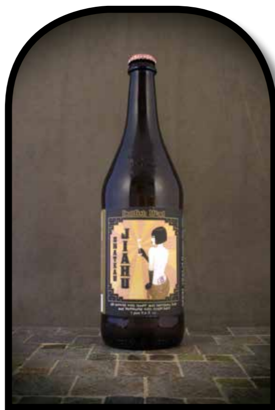
Sör 7000 éves kínai recept alapján (Dogfish Head Craft Brewery)