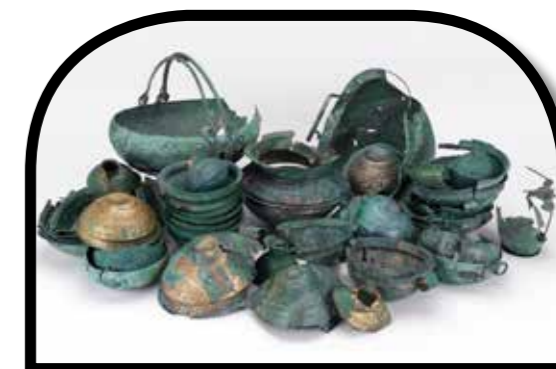
Az évans-i kincs