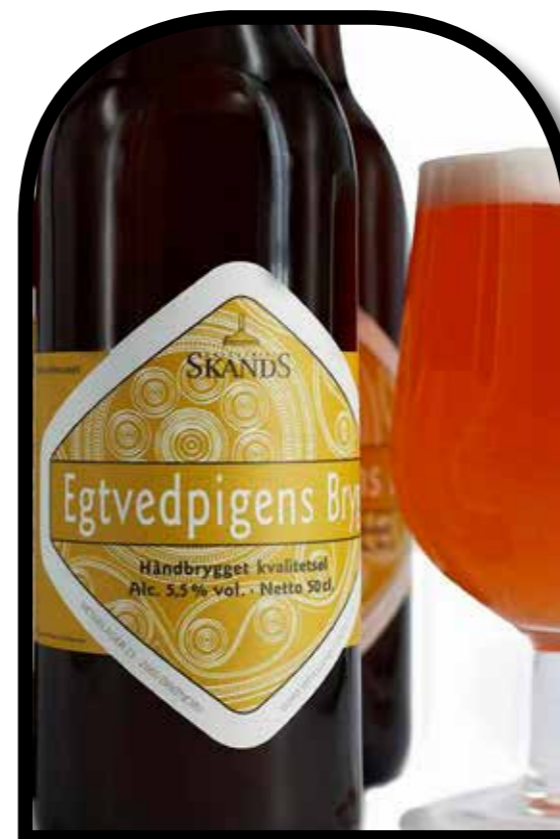
Alkoholos ital 3000 éves recept alapján (Egtvedpigens Bryg)

Ugyancsak a neolitikum időszakára keltezhető a Hajji Firuz Tepén (Északnyugat-Irán, Kr. e. 5400) előkerült folyadéktároló edény, amelyben infravörös spektroszkópia segítségével szőlőborra utaló borkósav és pisztáciafa gyantamaradványait mutatták ki. De hasonlóan jelentős az Örményországban feltárt rézkori Areni-1 barlangkomplexum