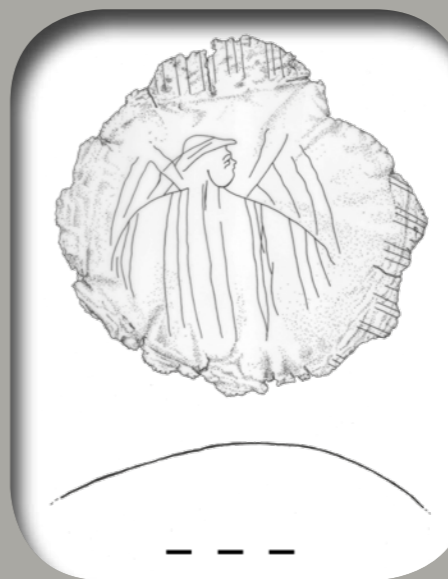
Csepel falu táljának rajza (rajz: Kuczogi Zsuzsanna)

A vésett díszű tálak rendelkezéséről megoszlanak a vélemények. A tálakat alapvetően két csoportra osztja a kutatás használati szerepük alapján. Az igényes, kisebb számban előforduló, szép mintázatú darabokat egyházi liturgiával hozzák kapcsolatba (szertartások előtt, közben kézmosásra használhatták), míg a stilizált nagyobb darabszámúban fellelhető tálakat már világi célokra szánhatták.