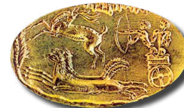
Egy mükénéi sírból származó arany pecsétgyűrű szarvasvadászat ábrázolásával

Az ideogrammnak a lineáris B írású, görög nyelvű agyagtáblák képszerű jelei, amelyek egy-egy fogalmat ábrázoltak, pl. LÓ, KOCSI.