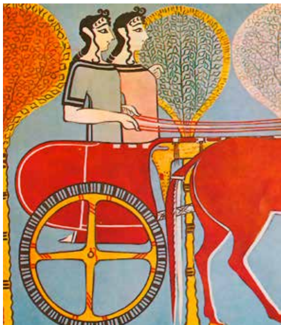
Bronzkori harci kocsi egy tirínszi falfestményen. A kocsit két asszony hajtja, vagyis a kép nem egy háborús jelenetet ábrázol

Nem csoda, hogy a lineáris B, a bronzkori görög szótagírás egyik megfejtője, John Chadwick megjegyezte: „A homéroszi harci kocsik szinte csak bérkocsik voltak, amelyek a harcosokat a csatába szállították és vissza.” Vagyis az esetek többségében nem a kocsin állva harcoltak. Igaz, a csatajelenetekben előfordul, hogy egy hős a kocsiról dárdázza halálra egy másik kocsin álló ellenségét, sőt annak kocsisát is: