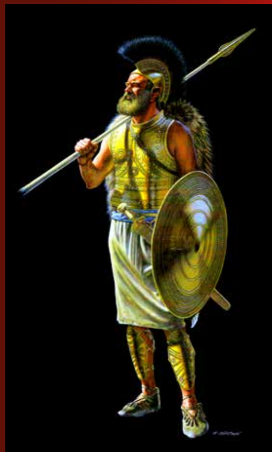
Karol Schauer rekonstrukciós rajza egy középkor- és nyugat-európai fegyverzetű elemeket hordozó késő bronzkori harcosról