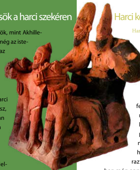
Harci kocsi agyagmodellje Ciprusról. A szigeten a bronzkor után is fennmaradt a harci kocsi használata

vadkanagyar sisakkal egy dendrai sírban találtak a Peloponnészoszi-félsziget északkeleti részén.