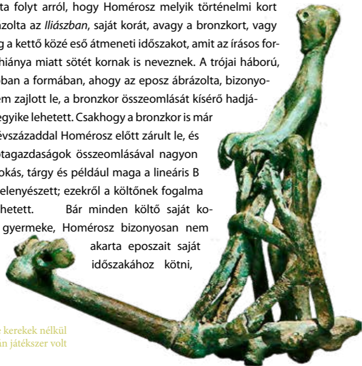
Harci kocsi bronzmodellje kerekek nélkül a Kr. e. 8. századból. Talán játékszer volt

Sok vita folyt arról, hogy Homérosz melyik történelmi kort is ábrázolta az Illiászban , saját korát, avagy a bronzkort, vagy esetleg a kettő közé eső átmeneti időszakot, amit az írásos források hiánya miatt sötét kornak is neveznek. A trójai háború, bár abban a formában, ahogy az eposz ábrázolta, bizonyosan nem zajlott le, a bronzkor összeomlását kísérő hadjáratok egyike lehetett. Csakhogy a bronzkor is már négy évszázaddal Homérosz előtt zárult le, és a palotagazdaságok összeomlásával nagyon sok szokás, tárgy és például maga a lineáris B írás is elenyészett; ezekről a költőnek fogalma sem lehetett. Bár minden költő saját korának gyermeke, Homérosz bizonyosan nem akarta eposzait saját időszakához kötni,