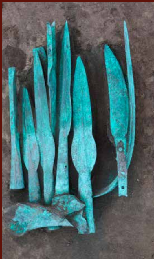
Előkelő harcos fegyverkészletét - (összeállított kardot, lándzsákat, kés, páncél, főredekelt) tartalmazó áldozati együttes Pázmándfalu határából (Kr. e. 13. század)

A leletanyag feldolgozása során kiderült, hogy a csatában legalább 3–4000 ember vett részt, és kb. 750–1200 halottal lehet számolni. A csontvázakon végzett izotópvizsgálatok azt bizonyítják, hogy a véres ütközetben elhunytak egy része a távoli Csehország térségéből érkezett ide, de voltak köztük a