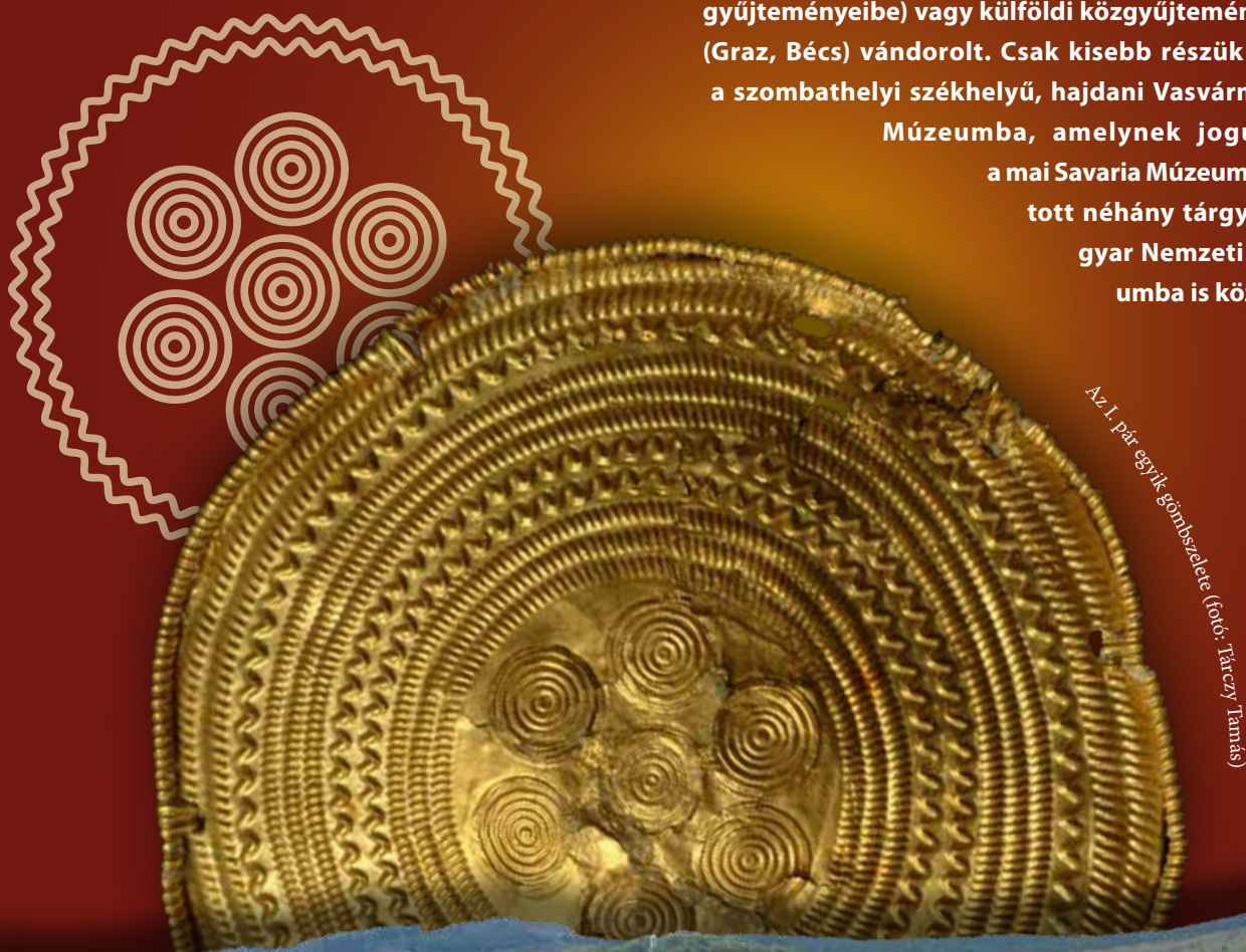
Az I. pár egyik gömbszelete