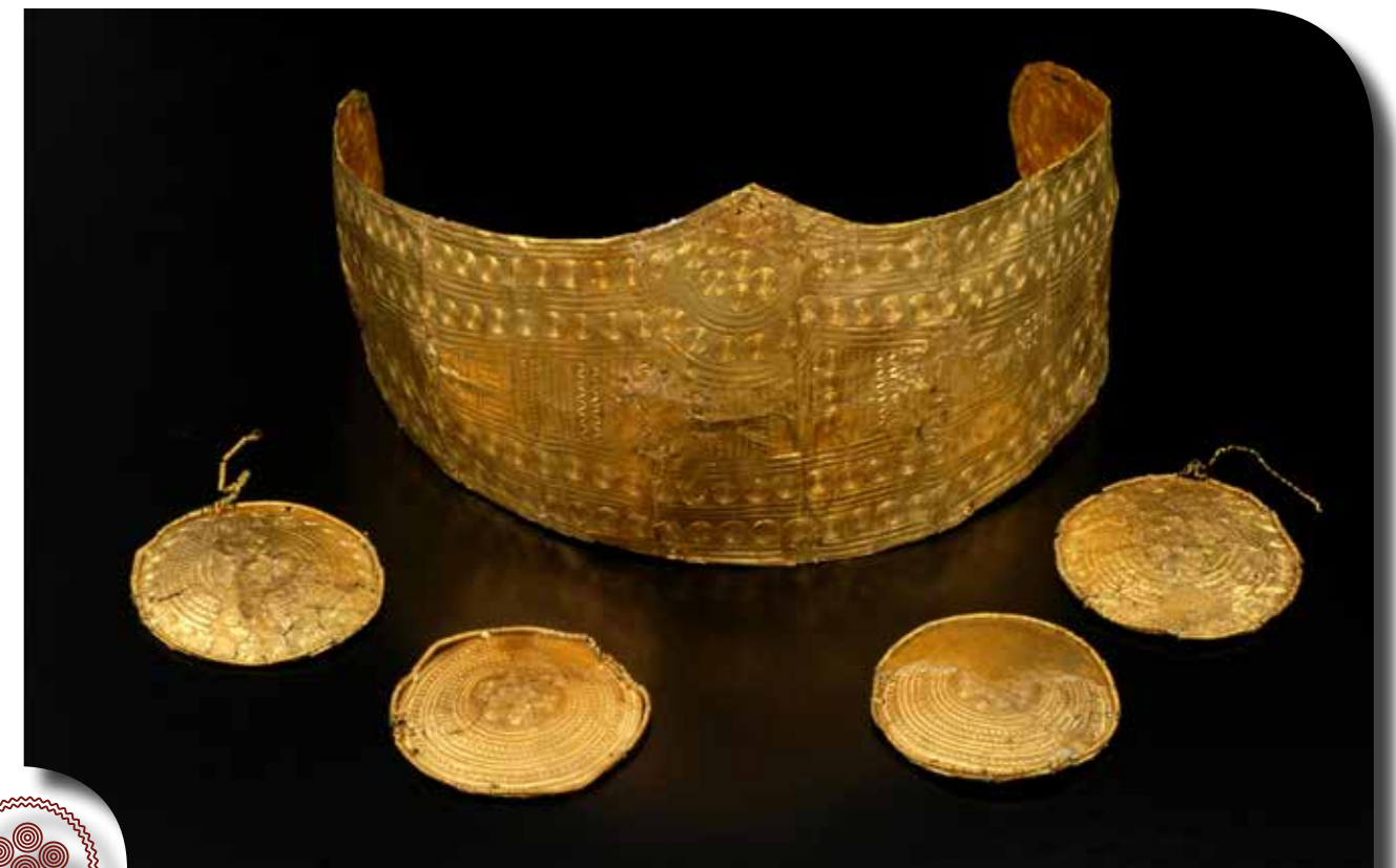
A diadém és a gömbszeletek

A Szent Vid-hegy templomával és teraszaival Velem község határában