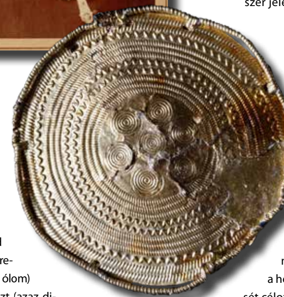
Az I. pár másik gömbszelete