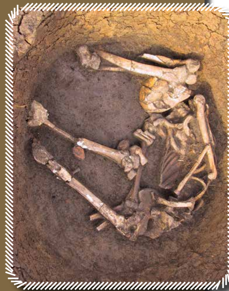
Gödörbe „hajtogatott” robusztus férfitest Ludasról

Kr. e. 1300 körül aztán az európai „trendekkel” párhuzamosan a Kárpát-medencében is szinte kizárólagossá vált a halotthamvasztás szokása. Az esetenként több száz urnasírból álló temetők nyomán ezt a periódust már urnamezős időszaknak nevezzük. Úgy tűnik, hogy a késő bronzkor második fele jelentős társadalmi változásokat is hozott. Az ipari léptéket öltő bronzművesség és az értékes nyersanyagok távolsági kereskedelme hozzájárult egy igen erős politikai és/vagy fegyveres elit felemelkedéséhez is. Feltételezhetően ehhez a vezető réteghez kötődnek a nehezen megközelíthető hegycsúcsokon és az Alföldön egyaránt hatalmas energiabefektetéssel épített erődítmények is. A több méter magas (földből, fából vagy kőből épített) falakkal és mély árkokkal körülvett „központokkal” egyidős nyílt színi és néhány épületből álló, eldugott zugokban található tanyaszerű települések nyomait is ismerjük.