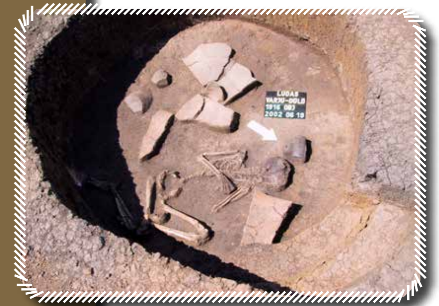
Középkorú nő zsurgított váza Ludasról. A holttest mellett egy nagy méretű, összetört tárolóedény darabjai, a hölgy koponyáján pedig égésnyomok láthatóak

A kisebb-nagyobb késő bronzkori települések lakói halottaikat rendszerint a településektől néhány száz méterre található, különálló temetőbe temették. A holttesteket máglyán elégették, a hamvakat urnákba gyűjtve vagy a sírgödörbe szórva, kerámiaedények, ételmellékletek és a halott ruházatához tartozó fémtárgyak kíséretében helyezték örök nyugalomra. Az Északi-középhegység területén élt úgynevezett Piliny-, majd Kyjatice-kultúra közösségeinek temetőiben az urnákat gyakran kőlapokból épített kamrákba helyezték, míg a dunántúli urnamezős kultúra sírkertjeiben a kerámiaedényeket általában egyszerű, kerek gödrökbe süllyesztették. Az Alföld keleti részén az úgynevezett Gáva-kultúra közösségei a jelenlegi ismereteink szerint különböző temetkezési szokásokat gyakoroltak, ám ezek nyomaira a régészeti feltárások során meglepően ritkán bukkanunk. Kis sírszámú, hamvasztásos és korhasztásos rítusú, halmos és sík temetőik a kultúra több tízezer négyzetkilométert lefedő elterjedési területén belül mindössze alig egy tucatnyi lelőhelyről ismertek.