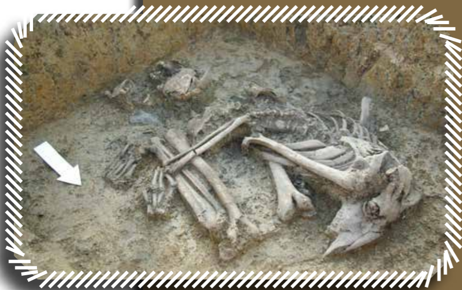
Kegyetlen rituáléről árulkodik az a pácini lelet is, amelyben a halott fejét eltávolították és egy kecske levágott koponyájával helyettesítették

A Pácín határában feltárt késő bronzkori településen összesen 12 igen gazdag urnasír és 6 gödörből előkerült „temetkezés” látott napvilágot. Az egyik ilyen objektumban egy fiatal, súlyos betegségekkel küzdő férfi zsugorított csontváza feküdt, akinek fejét az első 6 nyaki csigolyájával együtt eltávolították, és a medencéje mögé dobták. Az elhunyt vállai közé ezt követően egy kecske levágott koponyáját illesztették, a gödröt pedig betemették. A kegyetlen rituálét némi fantáziával akár büntetésként, akár tisztító szertartásként is értelmezhetnénk, ám az egyelőre rendelkezésre álló adatok csupán az ötleteléshez elegendők.