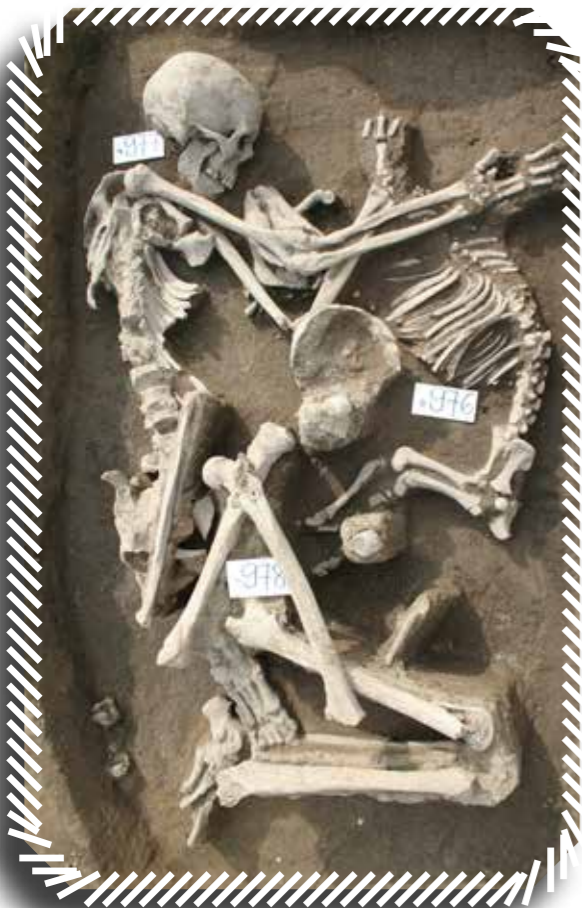
Felnőtt férfi és egy fiatal vaddisznó kettős sirja Pácín-Alharasztról

Hiába került elő azonban egyre több ilyen a Kr. e. 1300 és 800 közötti időszakból, a leletcsoport megjelenése anynyira változatos, hogy az egyes esetek között első ránézésre semmilyen összefüggés nem fedezhető fel. A holttestek egyesével vagy csoportosan, gondosan elhelyezve vagy ellenkezőleg: erősen bolygatott, sőt égett állapotban is a gödrökbe kerülhettek. Az antropológiai elemzések során kiderült, hogy a holttestek kezelésének módja nem függött sem az elhunytak nemétől, sem az életkorától. A települések objektumaiba „temettek” korfája a természetes populációkéhoz közelített, és – legalábbis a csontokon látható elváltozások hiányában – legtöbbször feltételezhetően természetes halállal halt meg.