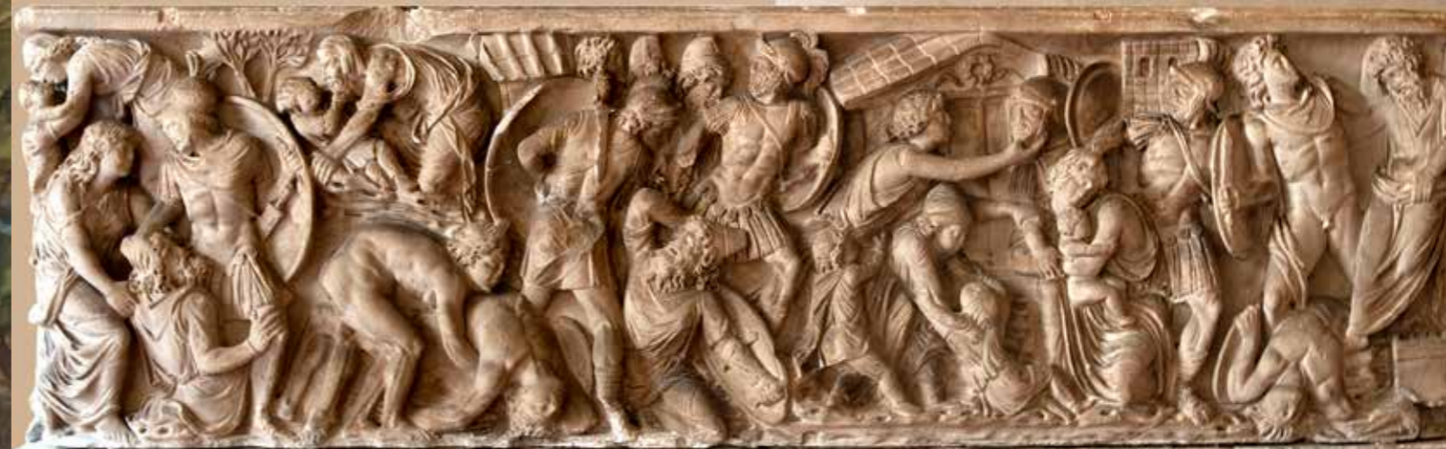
Kr. u. 2. századi római szarkofág részlete a trójai háború ábrázolásával

T rójához vagy török nevén Hisarlikhoz hasonló méretű és jelentőségű település az őskor más szakaszaiból több száz is ismert a Közel-Keleten. Ami Tróját kiemeli ezek közül, az az, hogy olyan századokban tett szert kiemelkedő szerepre, amikor az európai civilizáció első nevükön is ismert népei megjelentek, és mindez akkor történt, amikor a ma is használt betűírás a föníciaiak és a görögség révén kialakult és széles körben elterjedt. Ez utóbbinak köszönhetően tett szert Trója hallhatatlanságra, amikor az érte folytatott küzdelmet Homérosz az Iliászban és az Odüsszeiában az utókorra hagyományozta.