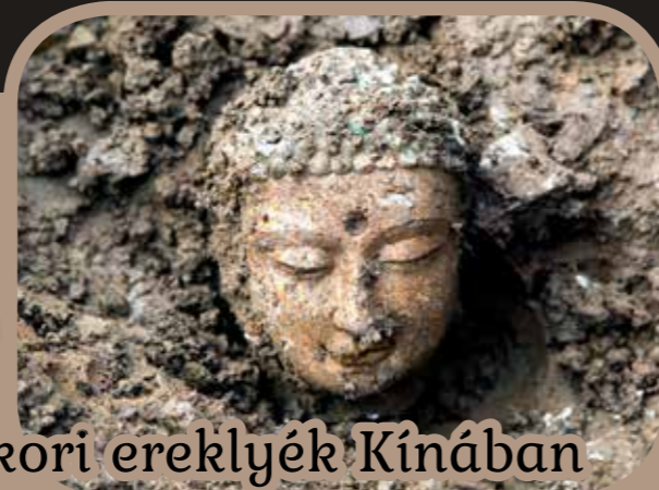
Ókori ereklyék Kínában

Kínában 2012-ben a munkások épp egy utat javítottak Gongchi faluban, amikor a munkálatok közben Buddhát ábrázoló szobrokra bukkantak. A következő évben el is indultak az ásások, melyek során mintegy 260, változatos méretű szobrot tártak fel a kínai régészek. A legizgalmasabb lelet mégis egy doboz volt, melyben emberi hamvakat találtak. A doboz felirata szerint két kínai buddhista szerzetes 20 év alatt összegyűjtött 2000 śarīrát (Buddha hamvai), amiket 1013. június 22-én temettek el. A maradványokat adományok útján, véletlenül vagy vásárlással szereztek meg. Egyelőre nem tudni, hogy a temetéssel egy időben kerültek-e oda a szobrok is, melyek különböző időszakokból származnak.