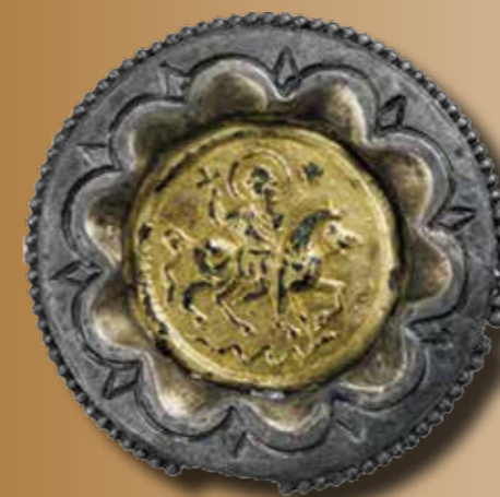
A nagyharsányi ezüst korongfibula lovas szent ábrázolásával

Egy nagyobb nemzetközi összefogás keretében a Márton pályájának és egyben életének kiindulópontját jelentő Szombathely városa, a Szombathelyi Püspökség és a Pannonhalmi Főapátság közös szervezésében egy nagyszabású kiállítás keretében kívánták a nagyközönség számára az emlékév időszakában bemutatni a mindenki számára csak távolról ismert szentet és korát. Míg a Vas megyei megyeszékhelyen Pannónia Márton születésének időszakában virágzó kultúráját, valamint az ott tapasztalható vallási sokszínűséget és a kereszténység 4. századi térhódítását mutatták be a kiállítás rendezői, addig az ezer esztendő Pannonhalmi apátság árnyékában, az Apátsági