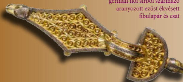
A répcelaki 5. századi előkelő germán női sírból származó aranyozott ezüst ékvéssett fibulapár és csat

A kiállítás harmadik nagy egységét a barbár elit emlékei jelentették, melyben a pogány-barbár alapok mellett a korai keresztény kultúra kapcsolat- és motívumrendszerei is egyaránt megjelennek. A barbár gyűjteményben a germán és steppei népek hiedelemvilágának egy-két jellegzetes emléke is helyet kapott, mely csak tovább színesítette a kiállításban megjelenő anyagot. A legkiemelkedőbb keresztény kapcsolatokat mutató tárgyak között a nagyszentmiklósi kincslelet edényei, a budakalászi korszó, vagy éppen a Kiskundorozsma határából előkerült szenzációs császárportrés csat (amely ugyancsak a szegedi múzeumban tekinthető meg) említhető, melyet a nagyobb közönség most először láthatott ilyen formában együtt. Az egykori barbár elit természetesen ezeknek a tárgyaknak a jelentős hányadát nem vallásos meggyőződésből, hanem sokkal inkább a korszak anyagi kultúráját meghatározni kívánó bizánci udvarban uralkodó divatok utánzásaként szerezte meg, készítette vagy viselte.