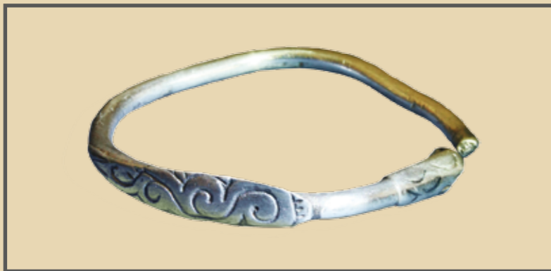
Ezüst köpűs karika