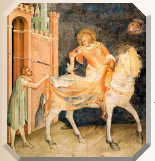
Szent Márton és a koldus (Simone Martini festménye 1320-ból)

Az európai néphagyomány szerves részét képezi a november 11-én ünnepelt Márton-nap, mely az őszi betakarításokkal és mezőgazdasági munkák éves rendjének hagyományos zárásával kapcsolódott össze. A magyar népszokások ezen a napon írják elő a liba fogyasztását és az újbórl kóstolását is. A természet lassú múlásának ünnepe a középkor egyik legkedveltebb katonaszentjének, a savariai születésű Szent Mártonnak a tiszteletével fonódott egybe a keresztény kalendáriumban. De ki volt Márton, akinek egyik leghíresebb tette, köpenyének kettévágása és annak a koldusnak történő adományozása az egész középkor egyik legkedveltebb képzőművészeti témája volt?