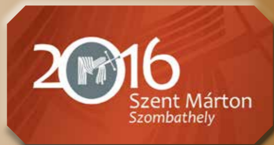
Az emlékvé logója

korai keresztény liturgiájának és emlékeinek bemutatása, a kereszténység továbbélése a tartományban és a régióban, valamint a barbár elit és a kereszténység kapcsolata. Az egyes tematikai egységeket a szent püspök élettörténetéből vett idézetek választották el, melyek egyben a látogatót át is vezették egyik részből a másikba.