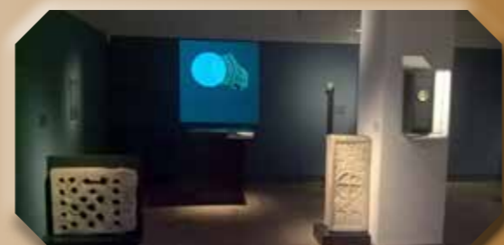
A késő antik templomi belső idéző pannonhalmi kőemlékek díszlete