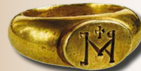
Bizánci kereszttel és tükrözötten bevéssett monogrammal díszített gyűrű Apahidáról

A kiállítás értékében és kulturális tekintetben is nagyon széles anyagot vonultatott fel, és sok esetben nemcsak a hazai gyűjtemények, hanem külföldi múzeumok anyagát is felhasználta mondandójának bemutatására. A kiállításban szerepet vállaló 24 hazai intézmény közül a legnagyobb arányban a Magyar Nemzeti Múzeum, a Keszthelyi Múzeum és a szegedi Móra Ferenc Múzeum járult hozzá tárgyaitnak kölcsönzése révén a kiállítás anyagának gazdagításához. A tárgyak gazdag és egyedi kivitelük révén sok esetben magukért beszéltek, emellett egy-két alkalommal talán bizonyos részleteket érdemes lett volna a múzeumlátogatók számára jobban kihangsúlyozni (például nagyító alkalmazása révén), ugyanis az egyediségek talán némely esetben elsikkadhattak számunkra a színes arany-ezüst kavalkádban. Továbbá a cseh és szlovák régészeti anyagból pár éve megrendezett, a 9–10. századi kultúrát és kereszténységet bemutató morva kiállításhoz hasonlóan talán érdemes lett volna még némi interaktív tartalommal is színesíteni és bemutatni a korszak szokásait és művelődését. A roppant gazdag leletanyagot felvonultató kiállításnak ugyanakkor egy magyar és angol nyelven egyaránt megjelent, a kiállítás címét viselő színes, változatos tematikájú kötet állít további emléket.