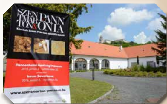
Az Apátsági Major Látogatóközpont

Az Apátsági Látogatóközpontban a korai kereszténység és a kora középkor spiritualitását és miszticizmusát idézte az enyhe félhomályban ügyes megvilágításokkal kísért installáció. Ez a kiállítótér letisztult egyszerűségével, a korai bazilikák világát idéző kerek megvilágításaival egyaránt az egykori „szent” épített környezet hatásának megelevenítését segítette. A pannonhalmi kiállítás alapvetően három fő tematikus egységre tagolódott: Pannonia