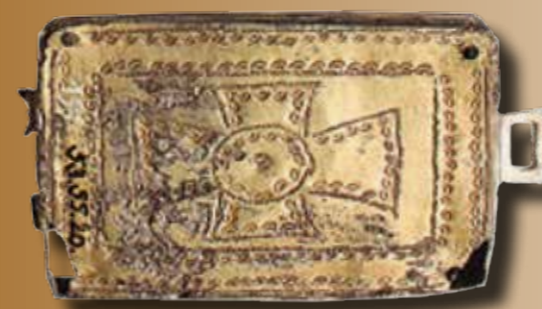
Ereklyetartó a szentes-nagyhegyi gepida temető 84. sírjából

keresztényekhez kapcsolt (az úgynevezett Keszthely-kultúra tárgygyűjtései, vagy épp az avarok kereszténnyé válásához kötődő emlékei). A különböző mellkeresztek, keresztek, bullák, ampullák és korporsókat díszítő lemezkeresztek mellett művészi és kulturális tekintetben is kiemelkedőek a különböző Keszthely-kultúrához kötődő korongfibulák. Szintén ebben a részben kapott helyet az egyébként a szegedi Móra Ferenc Múzeumban őrzött szentes-nagyhegyi gepida temetőből előkerült ereklyetartó, mely megtalálása óta európai hírnévnek örvend!