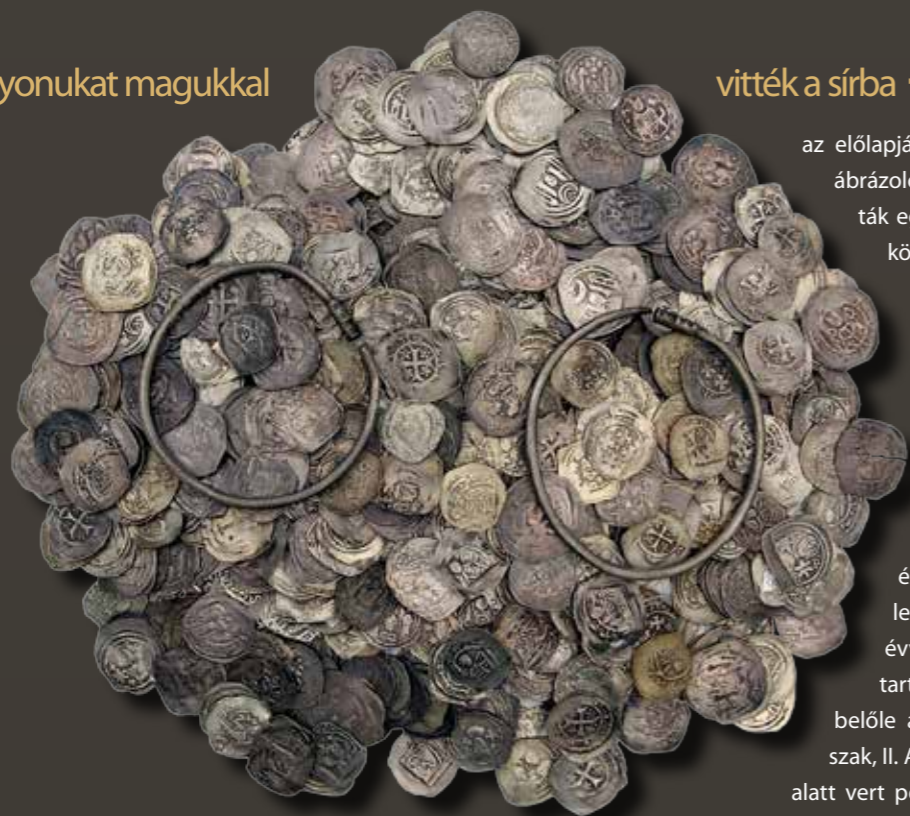
A ladánybenei éremlelet (Katona József Múzeum, Kecskemét)

Egy tipikus tatárjárás kori éremleletet alapvetően két veret csoport alkothat, amelyek egymáshoz viszonyított számaránya különbözhet, sőt léteznek csupán az egyik csoporthoz tartozó pénzekből álló kincsek is. A külföldi fizetőeszközöket a 12–13. századi, úgynevezett friesachi denár néven ismert pénzek felettébb heterogén tömege alkotja, ezeken kívül elvétve fordulhat elő néhány bécsi, kölni vagy angol denár. A friesachi denárok eredetileg a salzburgi érsekek által a karintiai Friesach városában a 12. század első felétől vert kiváló minőségű ezüstpénzek voltak. Később ez az elnevezés az eredeti friesachiak mintájára más világi és egyházi – karintiai és stájer hercegek, andesch-merani grófok, gurki és bambergi püspökök, aquileiai pátriárkák stb. – pénzverő hatóságok által a 12–13. század folyamán a Karintia és Krajna területén fekvő pénzverdékben kibocsátott denárok gyűjtőfogalmává vált. A friesachi veretek III. Béla ural-