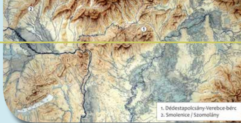
Dédestapolcsány-Verebce-bérc és Szomolány/Smolence-Molpír helyzete