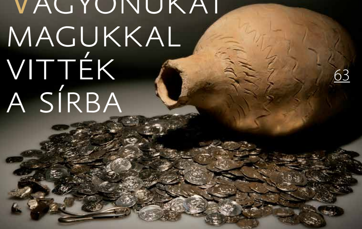
Cserépedényben elrejtett, friesachi denárokat és veretlen ezüstöt tartalmazó jászdzsai éremlelet (Damjanich János Múzeum, Szolnok)