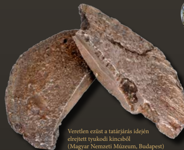
Veretlen ezüst a tatárjárás idején elrejtett tyukodi kincsből (Magyar Nemzeti Múzeum, Budapest)

A jelenleg ismert, száznál is több tatárjárás kori éremlelet zöme véletlenül került elő, jellemzően különféle földmunkák során, így csak nagy jóindulattal nevezhetjük őket zárt kincseleletnek, egy részük minden bizonnyal elkallódott. A nagy felületű régészeti feltárásoknak és a műszeres lelőhelyfelderítésnek köszönhetően az utóbbi évtizedben több olyan megfigyelést sikerült tenni, amelyek nem csupán újabb adatokkal gazdagították a tatárjárás kori pénzforgalomról vallott ismereteinket, hanem immár a korábban ismert kincseleletekkel egykorú települési szórványleleteket is sikerült dokumentálni. A Bács-Kiskun megyei Szank neve jól ismert a numizmatikai kutatásban, hiszen a településről már 1965-ben előkerült egy 113 darabos friesachi éremlelet, majd ettől függetlenül 1971-ben letek rá egy másik, legalább