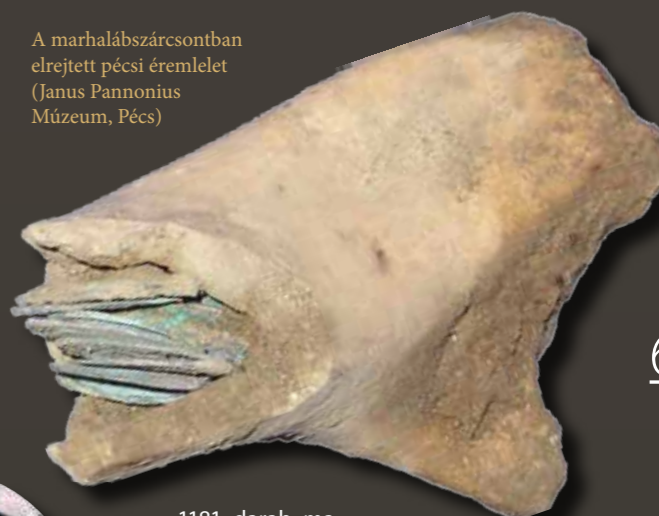
A marhalábszárcsontban elrejtett pécsi éremlelet (Janus Pannonius Múzeum, Pécs)

A leletek nagysága, korabeli értéke eltérő, sőt igen széles határok között mozog, darabszámuk a néhány tucattól a több százon át akár a 7–8000 darabig terjed. Az egyes leletek elrejtőinek társadalmi körét a korabeli árakra vonatkozó csekély írott forrásanyag alapján kísérhetjük meghatározni. Egy páncélt a 13. század elején (1220) és a végén (1291) egyaránt tíz márká értékűnek mondanak, az ökor ára fél márká (1239), egy marha ára fél (1273, 1294) és egy márká (1292) között szóródik, lóárakat egy-két márkától 10–15 márká értékig ismerünk. Kérdéses azonban, hogy milyen már-