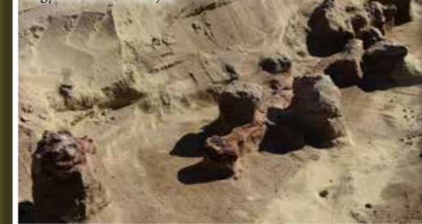
Határtalan Régészet - Archeológiai magazin