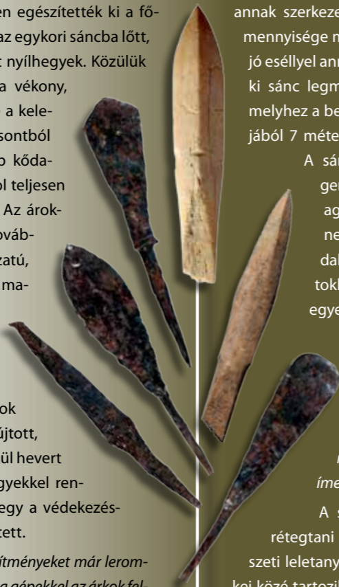
Csont és vas nyílhegyek

Szabadszállástól Kunfehértóig tucatnyi helyen sikerült azonosítani ehhez hasonló, több elemből álló védelmi rendszereket síkvidéki Árpád-kori templomok körül. E védművek régészeti feltárás nélkül, szabad szemmel többnyire nem észlelhetőek, így különösen nagy szerepet kapnak felkutatásukban a légitelvételek és a geofizikai vizsgálatok. Mivel a helyszínek többségénél a 13. század után már nem folytatódott az élet, így már az eljövendő ásatásokat megelőzően is jó eséllyel kapcsolhatjuk ezeket a lelőhelyeket a tatárjárás eseményeihez. A roncsolásmentes vizsgálati módszerek elterjedése és fejlődése révén nem kell majd meglepődnünk azon, ha a közeljövőben gombamód fognak megszorodni a hasonló emlékek.