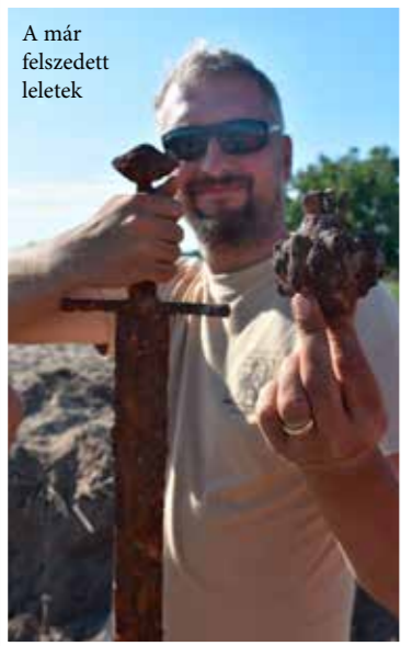
A már felszedett leletek

csolt érmekincsek rozzatába. Az igazi különlegességet azonban az árkokban heverő nagy mennyiségű fegyver, harci eszköz és felszerelés szolgáltatja. Harci balták, buzogány, törmarkolat, kések, kétkezes kardok szerelékei, páncéltörődékek mellett egy teljes épségében megmaradt egykezes, vércsatornával ellátott kard ad bizonyosságot a harci cselekményekről. Ezeket