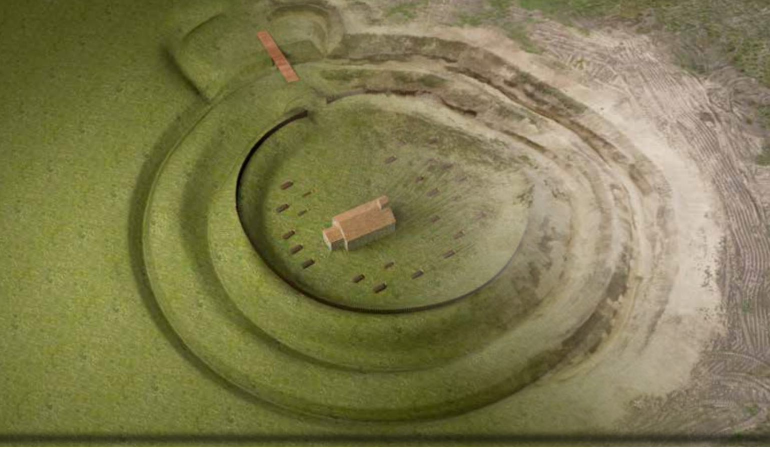
Szank tatárjárás kori védműve

A korabeli írott források a tatárjárás kapcsán többször is említik csatákat és ostromokat. De ezek mellett számtalan olyan ütközet is lezajlott szerte az országban, melyről nincsenek írásos emlékeink, vagy csak pontos helymegjelölés nélkül, általánosítva szerepelnek a krónikákban. A mongolokkal szembeni ellenállás az egész országra kiterjedt – a végeredmény alapján, néhány kivételes esettől eltekintve – sajnos inkább kevesebb, mint több sikerrel. A közelmúltban a Kiskun-