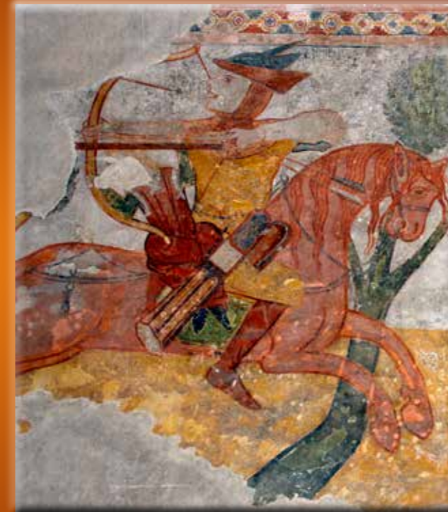
A kakaslovníci templom kun harcosa