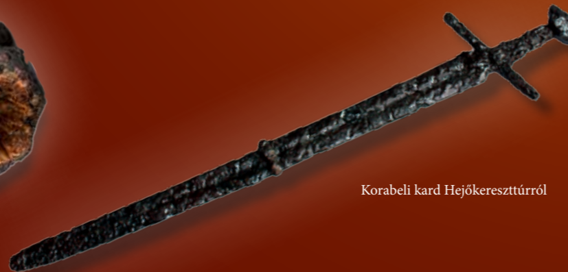
Korabeli kard Hejőkeresztúrról