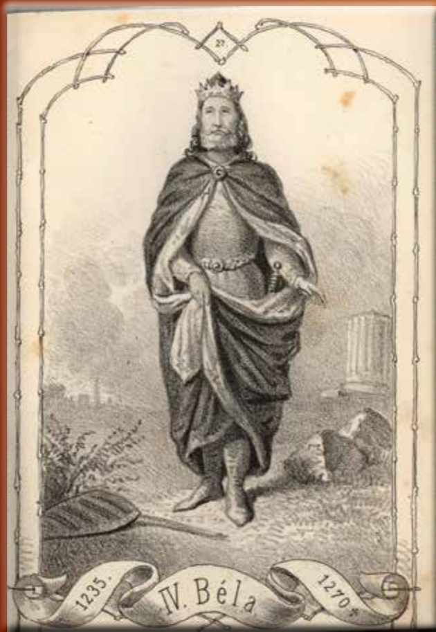
IV. Béla idealizált ábrázolása