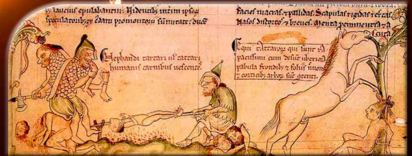
Embrevő tatárok a Chronica Majorából