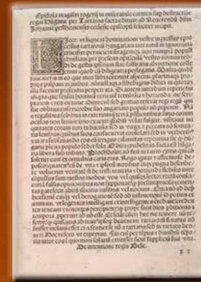
Rogerius Sivalmas énekének első kiadása

Az ország pusztulásával hozható összefüggésbe egy, az Árpád-kori Magyarország területén elrejtett kincsek közül kiemelkedő csoport is, amely minden kétséget kizáróan a tatárjárás idején került a földbe. Ezek között érmeleletek, vegyes érme- és ékszerleletek, illetve csak ékszereket tartalmazó leletek, továbbá vaseszközleletek is találhatóak. E jellegzetes lelethorizont leginkább a Dunától keletre, Északkelet-Magyarországon és a Duna-Tisza között figyelhető meg, azokon a vidékeken, amelyeket