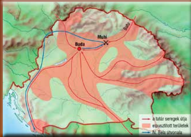
A tatárjárás (Mozaweb©2018)

Nem kétséges, hogy mind a kortársak, mind az utókor szemében a 13. század leginkább meghatározó eseménye a tatárjárás volt. A tatárjárást hosszú időn keresztül történelmünk olyan mérföldkövének tekintették, amely egy csapásra és döntően megváltoztatta Magyarország gazdasági-társadalmi, igazgatási, honvédelmi berendezkedését, külpolitikai irányvonalát, népességét, településszerkezetét. Ma azonban a kutatók többsége egyetért abban, hogy a tatárjárás bár tragikus eseménysorozat volt, az ország teljes pusztulásáról, ahogyan a kortársak írták, vagy amint azt korábban a kutatók is gondolták, nem beszélhetünk. A tatárjárás nem elindítója, hanem legfeljebb meggyorsítója volt azoknak a folyamatoknak, amelyek már a század első harmadában megkezdődtek, s a 14. század elejére fejeződtek be.