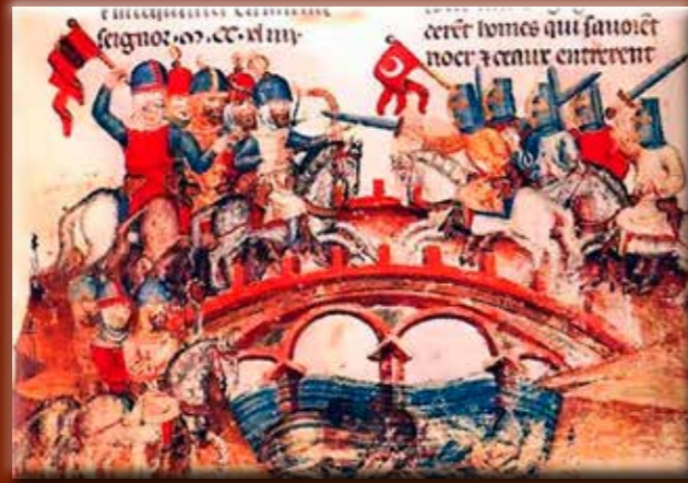
A muhi csata középkori ábrázolása