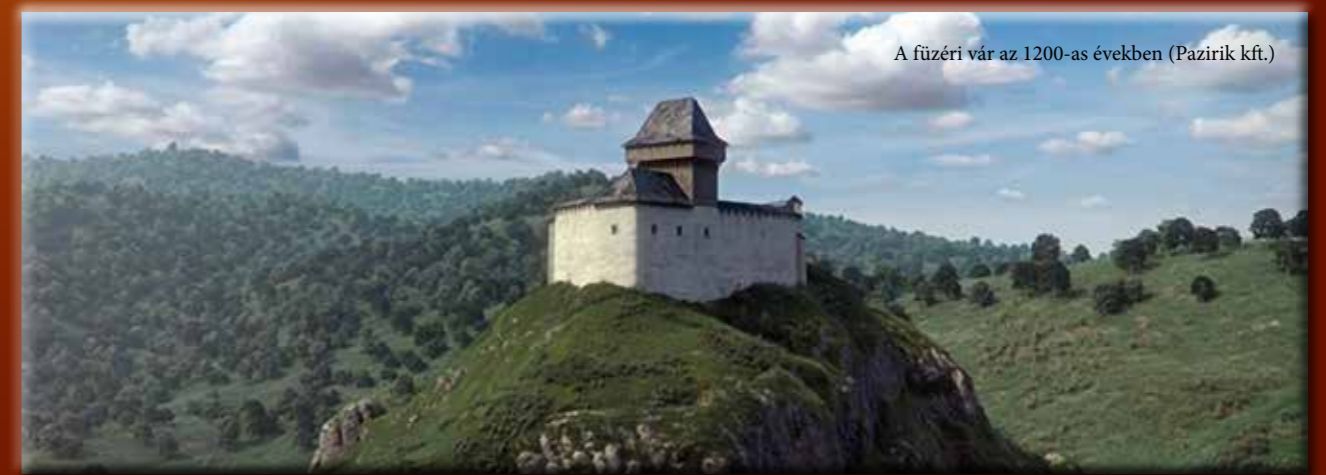
A füzeri vár az 1200-as években