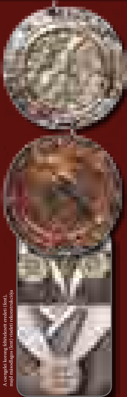
A csengelei korong feltételezett eredeti (fent), majd másodlagos (lent) viseleti rekonstrukciója

Maga a tárgy egy jellegzetes 10. századi honfoglalás kori készítmény, mely nagy valószínűséggel a század középső harmadában készült, de később még sokáig használatban volt. Erre utal a tárgy felső ívén látható ezüst függesztőfül – a párjának csak a csonkja maradt meg –, mely alapján egyértelmű, hogy egy idő után már nem bőrszíjjal a női hajfonatba erősített – egyébként többnyire párban előforduló – hajfonatdíszként, hanem nyakban felfűzve, medálként viselték.