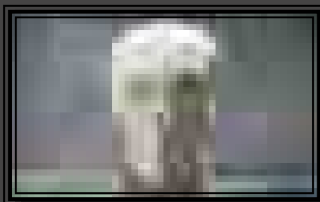
„A vezér személyesen” – az 52. sírban eltemetett harcos férfi arcreekonstrukciója