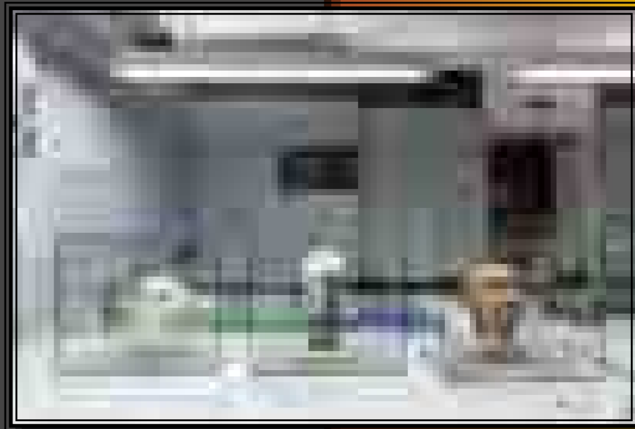
A kiállításban megtekinthető arcreekonstrukciók

* A kurátornak mindig van egy képe, egy elvárása arról, hogy mi marad meg a látogatóban a kiállításból. Mi úgy gondoltuk, az „Elit alakulat” – azaz a „honfoglalók egy kiválóított közösségének a rajza lesz az, amit majd a vendégeink hazavisznek tőlünk. Ennél azonban sokkal több történet, amit talán a vendégkönyv egyik beírása tükröz szívet melengetően a leginkább: „most kezdem igazán bánni, hogy nem lettem régész....”.