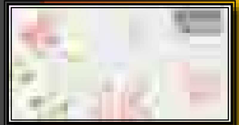
A karosi II. temető térképének részlete a lelettipusok jelölésével

rendelkezésünkre, hogy felvillantsunk valamit a honfoglalás kor rendkívül színes és változatos anyagi kultúrájából. Ezért végül úgy döntöttünk, hogy csoportba kötve nem csupán a tárgyakat, de mindazokat a forrásokat és módszereket is átnyújtjuk a látogatóknak, melyekkel a régész egy temető – legyen az honfoglalás kori vagy éppen avar kori stb. – feltárása és értékelése során dolgozik. A források közé sorolhatjuk a feltárt sírok rajzait, leírásait, valamint a temetők térképeit is. A sírt a feltárások során a régészek a benne talált leletekhez és jelenségekhez igazodva, különböző léptékben lerajzolják, a sírban látottakat, a bontás fázisait fényképen rögzítik, de alaposan le is írják, mivel később csak e rajzok,