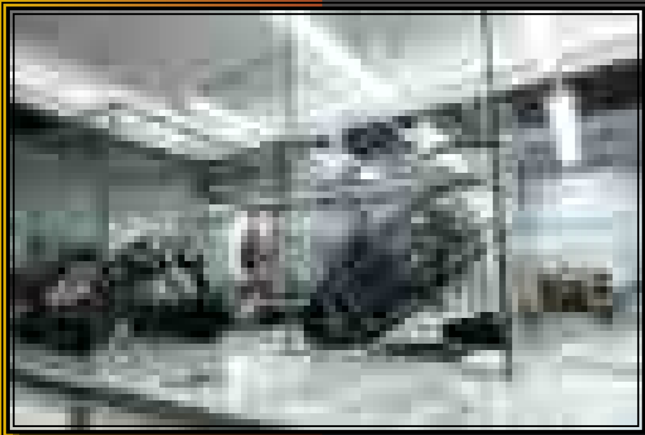
A veretes fanyereg és a készenléti íjtartó tegez vitrinjei

laloínak a világát. Nem megingathatatlanak mondott tételeket akartunk a látogató fejébe döngölni, hanem egy irányított párbeszédre invitáltuk.