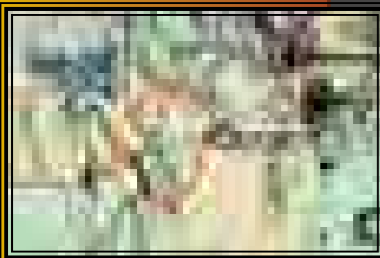
A karosi lelőhely a térképen

Az ásatások eredményét Révész László számos könyvben ismertette, majd tucatnyi konferencián, tudományos publikációban vitatták meg a szakemberek e temetők értékelésének, értelmezésének a lehetőségeit. A karosi temetők elemzése során a feltáró régész egy olyan világ lehetséges rekonstrukcióját rajzolta meg, amit ugyan a jövőben bizonyára lehet még tovább is árnyalni, de mindenképp alkalmas volt arra, hogy egy múzeumi kiállítás alapja legyen. A Karoson előkerült honfoglalás kori leletek – a vezéri szabályák, az ezüstveretes övek, a napkorong jelképével díszített keszkenléti íjtegezék vagy például a 29-es sír tarsolylemeze, esetleg a női sírokban talált aranyozott ezüst lószerszámveretek – önmagukban is megkülönböztetett figyelmet érdemelnek. A honfoglaló magyarok hagyatékának bemutatása céljából e tárgyak bejárták már Európa nagy múzeumait.