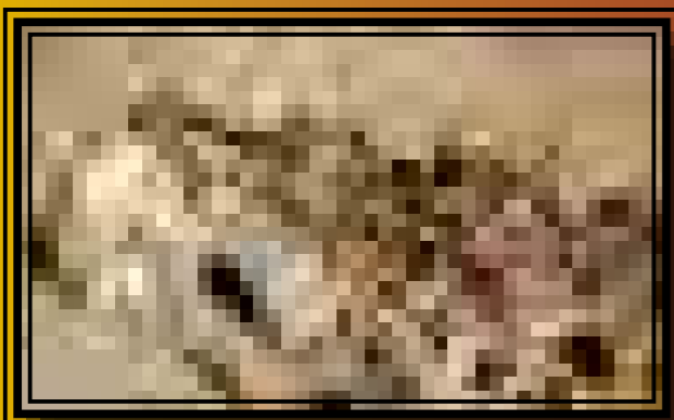
Az 52. sírban eltemetett férfi csontváza a fémveretekkel

A kiállítás struktúrája az egyéni vagy a kiscsoportos, családi felfedezésre épül. E felfedezés végére a látogató bizony el is fárad. Így szükség volt a szép tárgyak, a komoly módszerek és az okos gondolatok bemutatása után egy olyan térre is, ahol mindezt feloldjuk, a látogató pedig kifújhatja magát. A harmadik terem jurtájában a gyerekek például beöltözhettek honfoglaló vitéznek, a nagyobbak pedig egy, a kiállításra épülő kvíz segítségével pedig eldönthetik, hogy melyikük lenne jobb honfoglaló vezér vagy éppen régész.