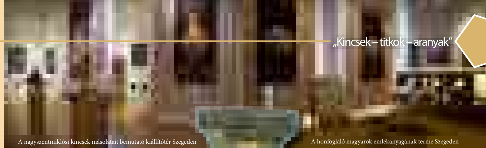
A nagyszentmiklósi kincsek másolatait bemutató kiállítótér Szegeden