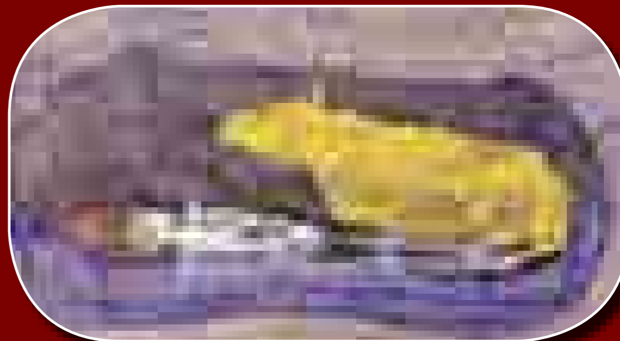
A 6. sír digitalizációjának első fázisa (Réti Zsolt munkája)

jó megtartású csontváza feküdt. A vázon és a váz mellett számos, főként aranyozott ezüstből készült test- és ruhaékszer került elő. Kiemelkedő lelet a nő hajfonatait díszítő nagy méretű lemez hajfonatkorongpár, a finoman font huzalból kialakított nyaklánc és a honfoglaló magyar nőknél divatos gömbsorcsüngős fülbevalópár, melyek karikáit a lánc két vége kötötte össze, ami igen ritka jelenség.