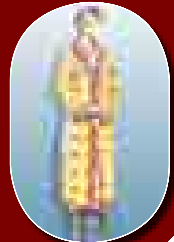
Az 5. sírban feltárt leletek viseleti rekonstrukciója (Boldog Zoltán rajza)

A temetési szertartás menetének rekonstrukciójához számítógépes szimulációt készítettünk. Ennek alapján számunkra az tűnik a legvalószínűbbnek, hogy a lómaradványokat még a sírgödörön kívül, előzetesen valamennyire összehajtották, azaz előkészítették a sírban való elhelyezésre. Ez annál is való-