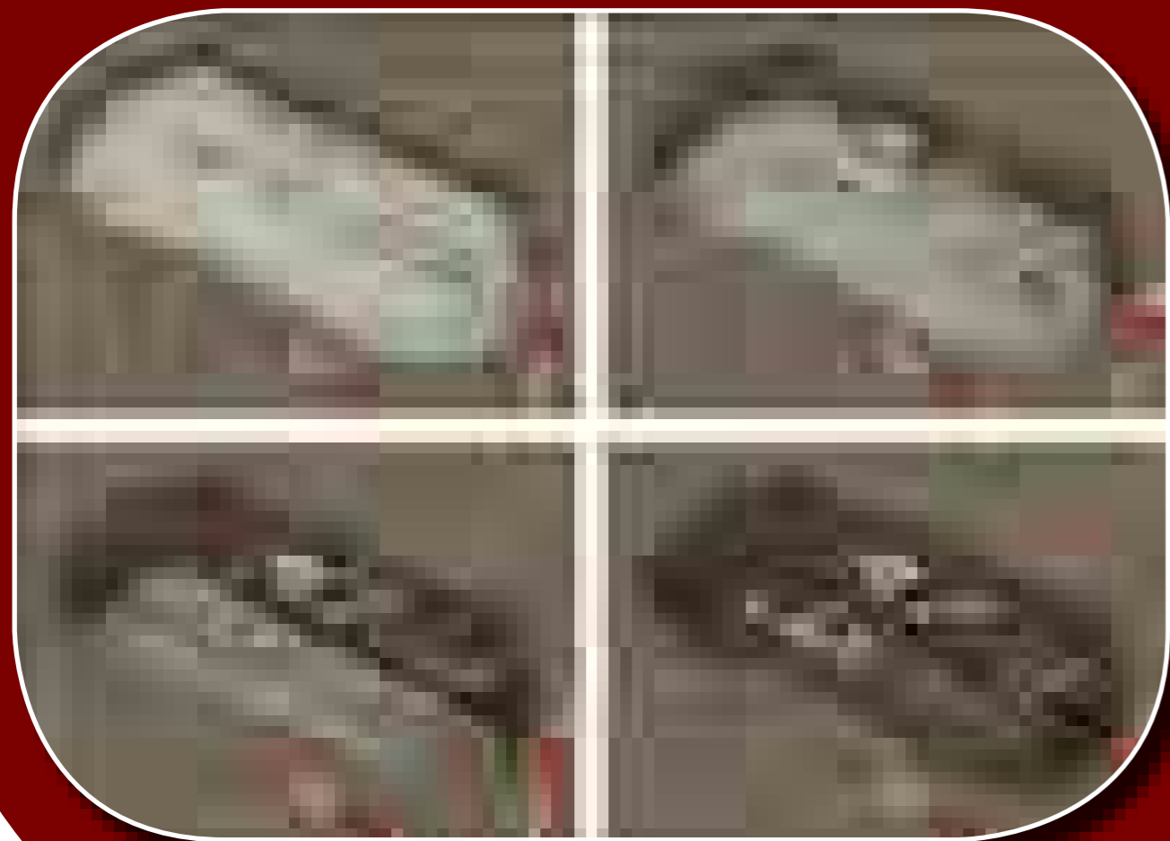
A 6. sír digitalizációjának második fázisa (Réti Zsolt rajza)

Érdemes kitérni az itt talált leletanyagra is. A korábban már ismert 4. számú sír felsőruházatát például gazdagon díszítették aranyozott ezüstveretekkel. Ehhez hasonló, de még kiemelkedőbb régészeti leletanyag a sírsor középső részén fekvő, 5. számú sírből került elő. Érdekes (és szerencsés) módon a váz lábát az 1940-es feltárás egyik kutatóárka már megbolygatta, akkor azonban a temetkezés még nem került feltárára. Erre csak 2002-ben került sor. A sírban egy 20-21 éves fiatal nő