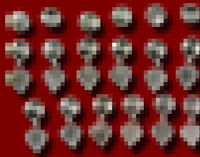
Kéttagú csüngős ruhaveretek a 4. sírből