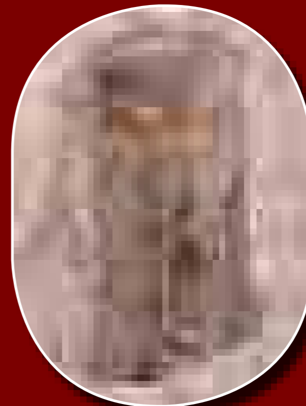
A bolygatott 6. sír feltárás közben

A temetkezések közel felénél fordultak elő lócsontok és lószerszámok. Közöttük a 6. számú sír, amelyben egy 46–52 éves korában meghalt férfi feküdt, különösen érdekesnek bizonyult. A lekerekített sarkú, téglalap alakú sírgödör hosszanti oldalai mentén egy-egy 10–25 cm széles padka húzódott. Az északi oldalon található padkán egy oldalt összehajtott lóbőrt tartalmazó, úgynevezett részleges lovas temetkezés maradványai feküdtek. Az áldozati ló egy kifejlett, 9 éves mén volt. A ló végtagjai közül három a sírgödör alja és az emberi váz