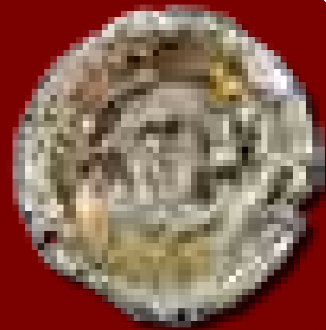
Ezüst alapú ötvözetből készült aranyozott préselt veret az 5. sírből

irányában feküdt, patával kissé lecsúszva a padkáról, de teljes rácsúsztatás az emberi vázra valószínűleg az egykor alatta lévő bőrtömeg akadályozta meg.