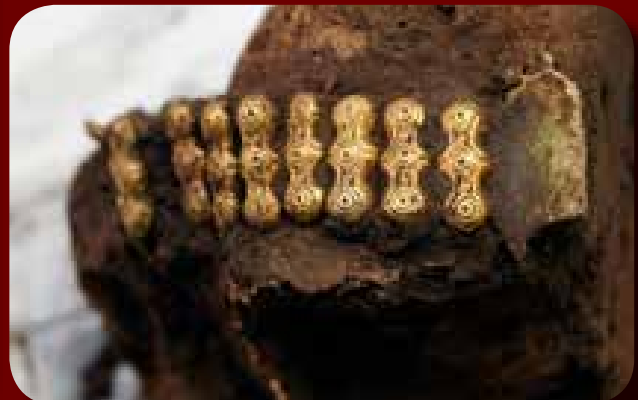
Viseleti helyzetben előkerült pártaveretek