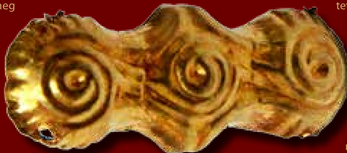
A háromkaréjos pártaveret

Az itt előkerült háromkaréjos pártaveretek típusát szerte az országban eddig alig több mint 10 lelőhelyről ismerjük. Ezek közös jellemzője, hogy függőlegesen összekapcsolódó három körből állnak, így kialakítva a három karéjt. A formája leletegyüttesenként mindegyiknek azonos, de a minta mindig eltér, két egyforma típus két különböző lelőhelyről még nem került elő. Tudomásunk szerint a Derecskén feltárt temetkezés előtt a legtöbb egy sírban talált háromkaréjos pártaveret száma nem haladta meg a 20-22-t, így a derecskei avar kislány sírjában feltárt 35 darab kiemelkedően soknak számít.