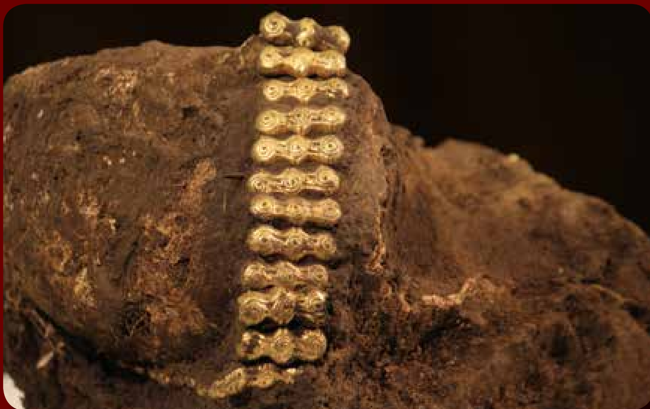
A kislány koponyája a 2016 augusztusában tartott sajtótájékoztató középpontjában