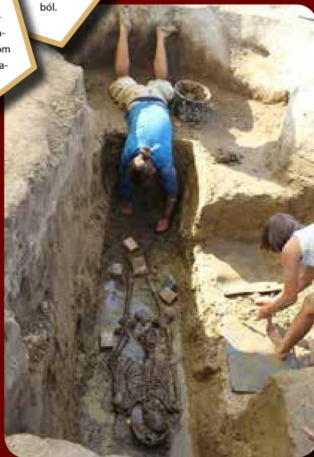
Extrém sírbontás

radt, 6 darabot pedig állatjáratokban találtunk meg, ezek a felsőtest környékén szóródtak szét. Az aranylemezes fejdíszeken kívül ezüstlemezgyöngyöket is feltártunk a sírban, amelyek a ruha díszítésére szolgálhattak, avagy