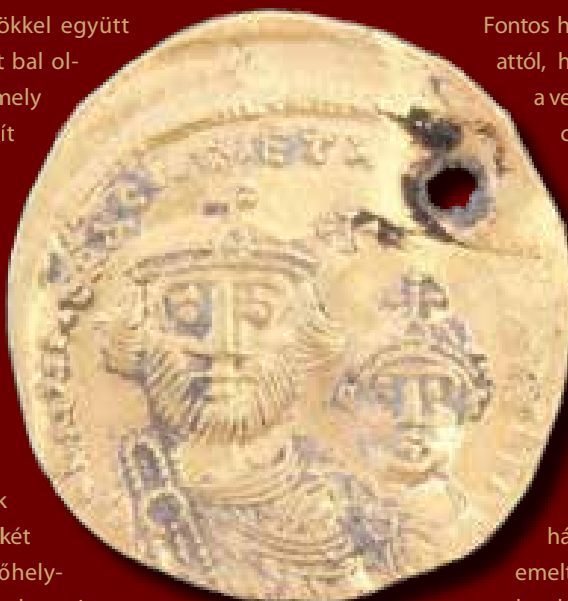
A solidus , közvetlenül a sírból való felszedés után