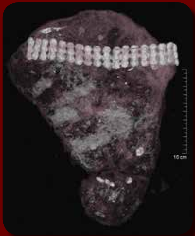
CT-felvétel az in situ kiemelt koponyáról

Fontos hangsúlyoznunk azonban azt is, hogy attól, hogy a homlokon kerültek elő ezek a veretek, még nem tudjuk a pontos funkciójukat meghatározni. Ezek lehetnek párta vagy hajleszorító pánt részei is, de a sapka szegélyét díszítő veretek is akár. Reméljük, a derecskei avar kislány sírjából viseleti helyzetben előkerült veretsor további vizsgálata közelebb visz idővel bennünket ennek a kérdésnek a megválaszolásához.