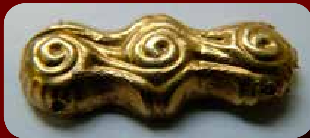
Felvarráásra szolgáló lyukak