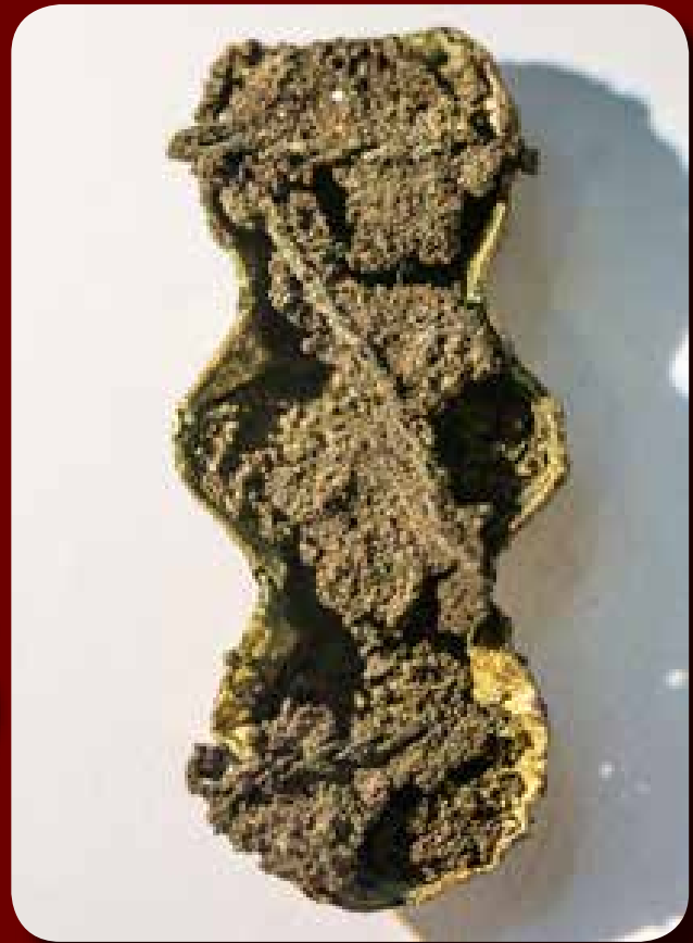
A felvarrás módját megőrző cémaszálak a veret hátoldalán

maradtak meg viseleti helyzetben a pártaveretek (itt összesen 14 darab került elő belőlük), mint a kislány esetében.