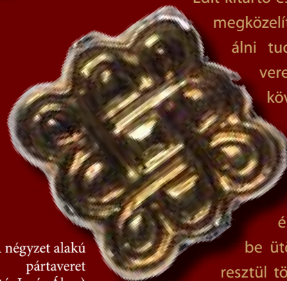
A négyzet alakú pártaveret