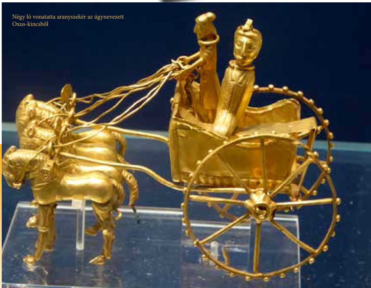
Négy ló vonatatta aranszekér az úgynevezett Oxus-kincsből