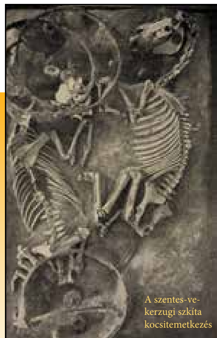
A szentes-vekerzugi szkíta kocsitemetkezés