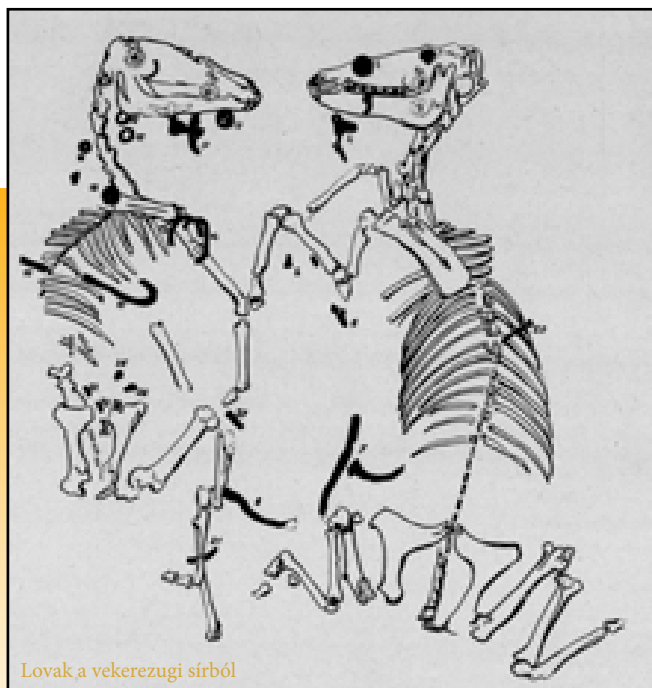
Lovak a vekerzugi sírból

A szórt hamvas temetkezések esetében a maradványok a sírgödör alján kerülnek elhelyezésre. Több „forgatókönyve” is létezik ennek a rítusnak: előfordul, hogy a hamvakat egy halomba helyezik el, vagy a sír alján szabálytalanul, de az is megeshet, hogy a sírgödör visszatemetése közben szórják bele a sírba a hamvakat. Ilyenkor a feltárás közben a földdel keverednek emberi maradványok, hamu, szén stb. Urnás temetkezések esetében a hamvak egy speciális edényben kerülnek eltemetésre.