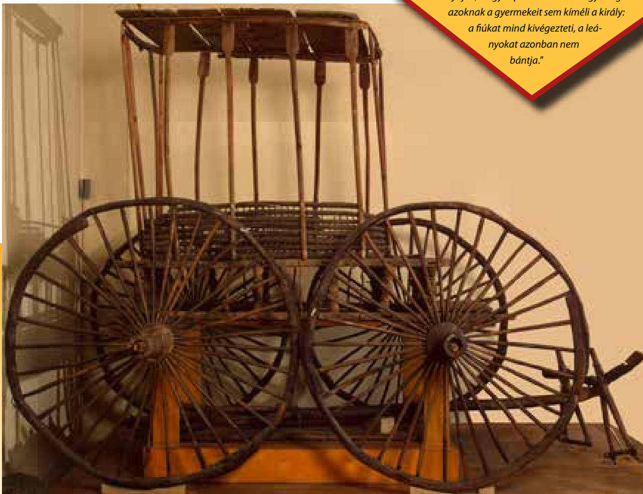
A paziriki kocsi a szentpétervári Hermitage-ban

Hérodotosz ír a szkíták kocsiiban történő elégetéséről is: „Ezeket aztán így végzik ki. Megraknak rőzsével egy szekeret, ökröket fognak elébe, a jósokat pedig megbilincsel lábbal, hátrakötött kézzel, betömött szájjal odaültetik a rőzserakások közé. Aztán meggyújtják a rőzsét, és nagy kiabálással az ökrök közé csapnak. Nem egy ökör odaég a jósokkal együtt, van, amelyik csak megpörkölődik, amikor a kocsi elég. De más vádak alapján is végeznek így ki jósokat, amikor rájuk bizonyítják, hogy álpróféták. Akit így megölnek, azoknak a gyermekeit sem kíméli a király: a fiúkat mind kivégezteti, a leányokat azonban nem bántja.”