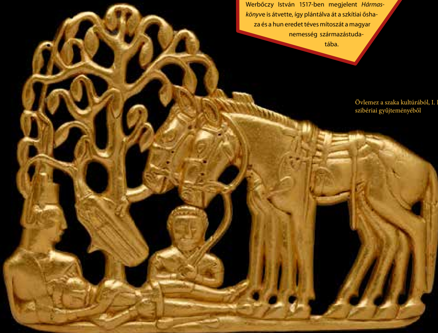
Övlemez a szaka kultúrából, I. Péter szibériai gyűjteményéből

A szkíták a magyar historikus hagyományban, illetve részben a népi emlékezetben úgy élnek, mint a magyarság közvetlen elődei. A magyar kútfők közül elsőként Anonymus az 1210 táján írt művében eredeztette a magyarokat a szkítáktól. A magyarság szkítiai őshazájának ismertetését Kézai Simon 1282–1285 között született munkájában a hun származás mondájával egészítette ki. A hun eredet hagyományát több középkori krónika ( Bécsi Képes Krónika , Budai Krónika , Thuróczi János, Bonfini krónikája), valamint Werbőczy István 1517-ben megjelent Hármas-könyve is átvette, így plántálva át a szkítiai őshaza és a hun eredet téves mítoszát a magyar nemesség származástudatába.