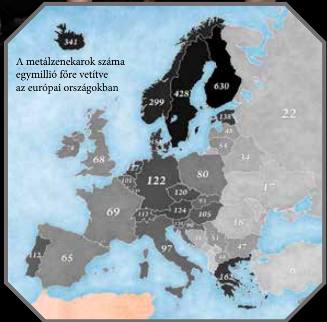
A metálzenekarok száma egymillió főre vetítve az európai országokban

A magyar zenészek közül a Kylfingar együttes képviseli a viking metál vonalat. A jászági zenekar névválasztása igen tudatos: a kylfingar egy a keleti vikingekhez, a varégokhoz kapcsolható népcsoport, ami azonosítható a magyar korai történelemben is felbukkanó kölpényekkel. A 2012-ben alakult banda eddig egy kislemezt, valamint egy nagylemezt adott ki Hallhatatlanok címmel 2014-ben, jelenleg második nagylemezük megjelentetésén dolgoznak. Figyelemre méltó, hogy az északi témák mellett a Botond-mondát is feldolgozták.