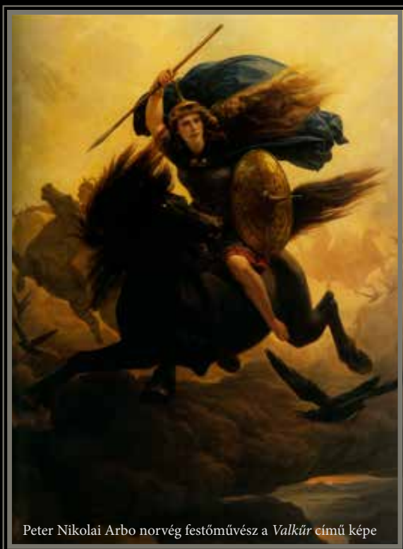
Peter Nikolai Arbo norvég festőművész a Valkür című képe

Mindenki fejében él a kép a szakállas, nagydarab bárharcos férfiakról, rettenthetetlen fegyveres asszonyokról, s a félelmetes sárkányos orrdíszsel ékített hajóikról, amik a ködből előszva keltének félelmet a szívekben. Ezeknek a történelmi toposzoknak széles körű elterjedésében nagy szerepet játszanak éppúgy a klasszikus zeneművészet nagyjai, mint a modern idők zeneszerzői. Az évszázadok múlásával a zene egyre jelentősebb szerepet játszott az emberek életében. A technika fejlődé-