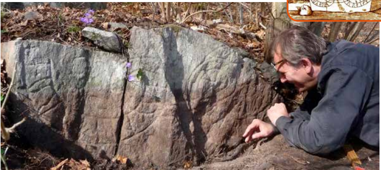
A Vaxholm mellett előkerült U170 jelű rúnakő