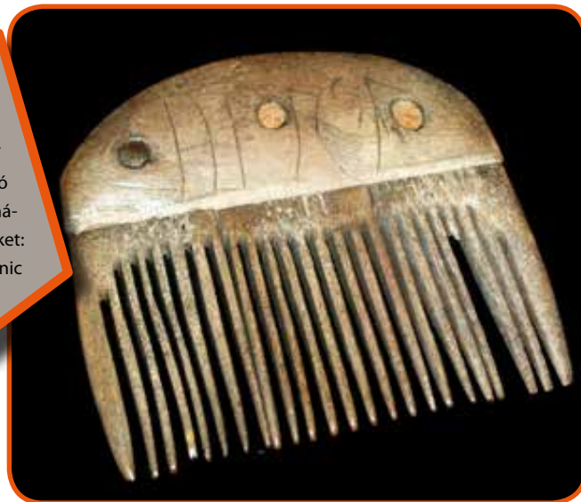
A Vimose-fésű: a legrégebbi rúnairásemlekként ismert, egy fából készült, félkör alakú fésű, amelyen a rúnák írásai láthatók.

A „hétköznapi” feliratok azonban már csak a viking kor végéhez közeledve váltak gyakoribbá, épp csak megelőzve a kereszténységgel érkező latin betűs írásforma széles körű