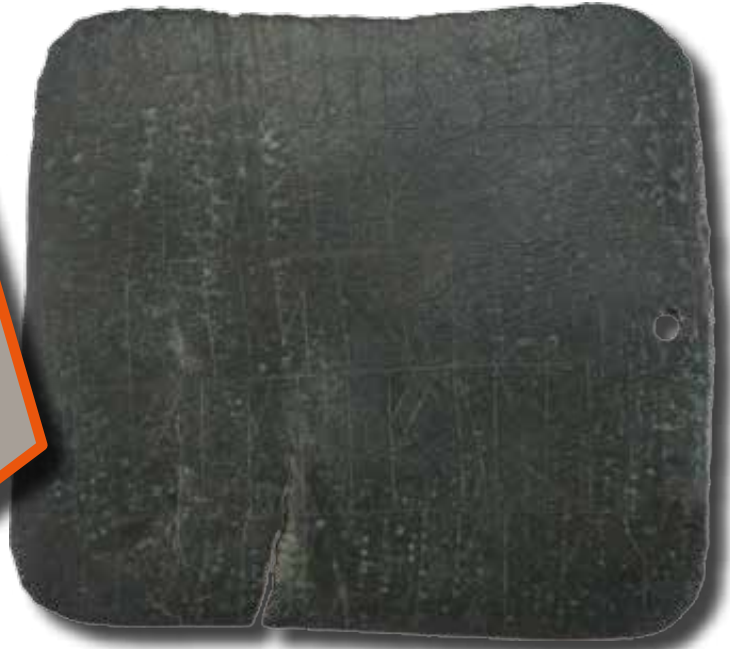
Rúnafeliratos réztábla, Stenåsa, Svédország