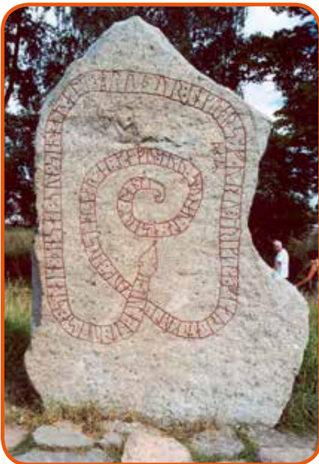
Gripsholm-kő, a leghíresebb az Ingvar-kövek közül. Remekül kivehető rajta a rúnakövek jellegzetes szövegszalagja, amelyet egy kis fúrfanggal gyakran alakítottak kígyóvá