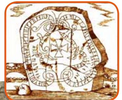
... és 300 éves ábrázolása (Johan Peringskiöld)