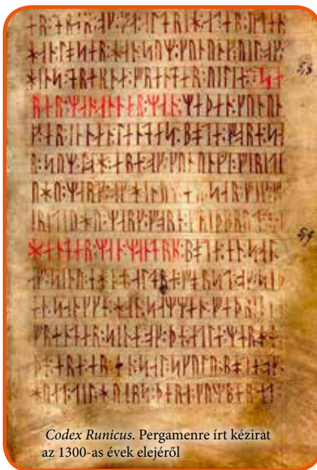
Codex Runicus. Pergamenre írt kézirat az 1300-as évek elejéről

fedezték fel újra a közel kétméteres követ, amelyet valószínűleg Jarl állított apjának, Gerfastnak. A jellegzetes stílusjegyek miatt a régészek szinte biztosak benne, hogy az egyik legtermékenyebb 11. századi rúnafaragó, Fot keze munkája.