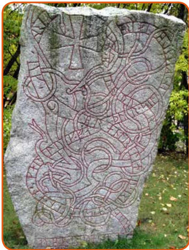
Az egyik uppsalai rúnakő

Néhány éve, 2011 februárjában a mainapig ismeretlen graffitisek zöld festékkel megromgálták a templomkertben álló nagyobbik követ. Ezt akár a történelem fitorának is tarthatnánk,