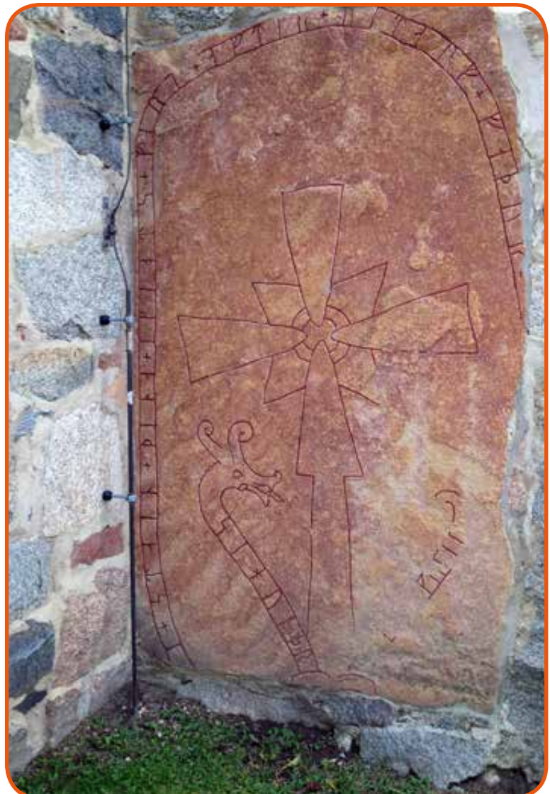
Egy falba épített gamlai rúnakő