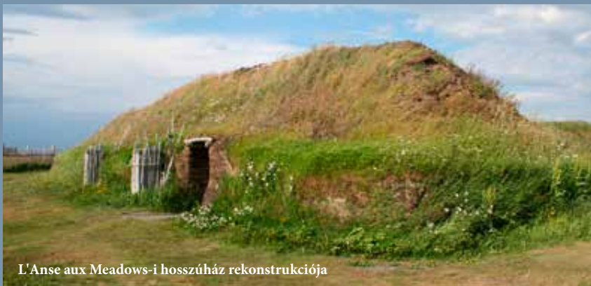
L'Anse aux Meadows-i hosszúház rekonstrukciója

A kovácműhely egy vasolvasztó és egy faszénégető kemencéből állt. A környék gyepvasércben igen gazdag volt, melyből elsősorban szögeket készíthettek. (Egy hosszúhajó építéséhez kb. 7000 db, közel 440 kg összsúlyú szög volt szükség, melyet mintegy 30 tonna gyepvasból tudtak csak kinyerni.) A nagy épületekben volt egy asztalosműhely is, ahol a faanyagot dolgozták fel a hajók számára. Ha az összes házat egyidejűleg lakták, akkor mintegy 70–100 ember, vagyis két-három hajó légnysége fért el bennük.