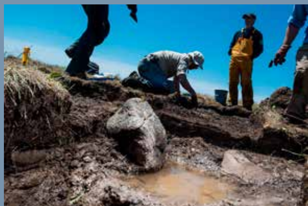
Point Rosee-i feltárás, előtérben a tűzhelyet körülvevő kövekkel

Ezen újabb felfedezések tükrében ma már úgy tűnik, hogy Vinland nem egy konkrét település, hanem egy vidék elnevezése lehetett, és a mai Új-Fundland egészét érthették alatta.