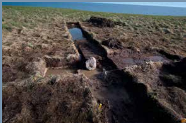
Point Rosee-i feltárás: kutatóárok

kokkal állnak majd elő. Mindenesetre további lelőhelyek megtalálásához érdemes lenne használni Sarah Parcak módszerét is.