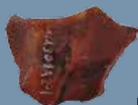
Jáspisból készült, közel 2,5 cm-es tűzkő a Notre Dame-öbölből

A feltárás során találtak csontból készült dísztűt és zsírkből faragott orsógombot is – ezek tipikusan női használati eszközök –, így bizonyos, hogy néhányan asszonyaikkal együtt érkeztek ide. A radiokarbon vizsgálatok eredményeiből tudjuk, hogy a települést Kr. u. 990–1030 között lakták.