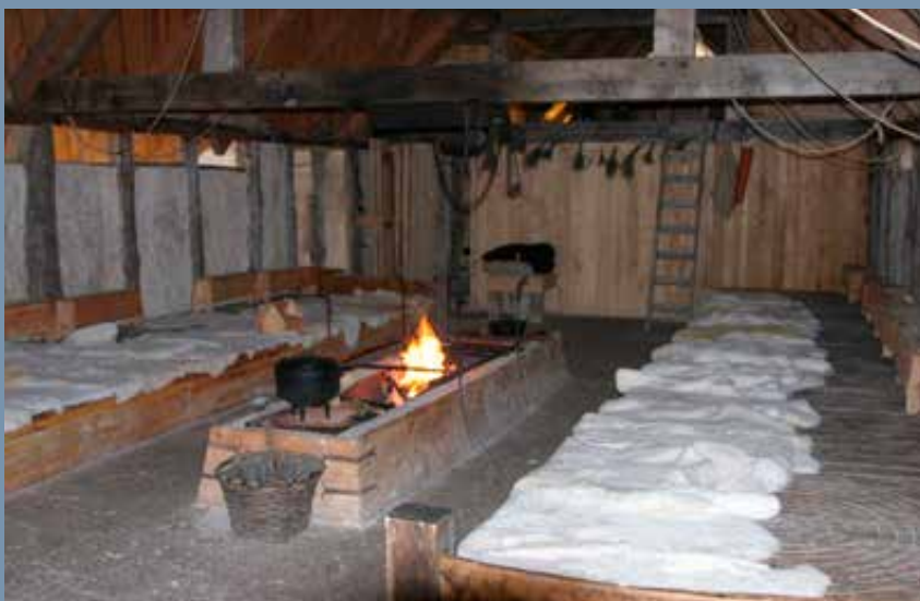
L'Anse aux Meadows-i hosszúház belőről

Abban a kérdésben, hogy ez lenne-e a sokat emlegetett Vinland, egyelőre még nincs teljes egyetértés. Annyi azonban megállapítható, hogy egy rövid életű településről van szó, melyet 5–10 év közötti időnél tovább nem használhattak. A kutatók egy része éppen ezért valamilyen átmeneti állomásnak, vagy a hajók javítására szolgáló alaptábornak gondolja ezt – erre utalna az asztalos- és kovácműhely, valamint a gyepvas feldolgozása is –, és Vinlandot délebbre, egyelőre ismeretlen helyre feltételezi.