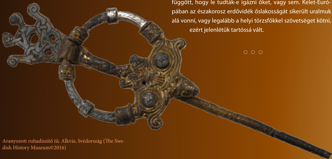
Aranyozott ruhadíszítő tű. Alkvie, Svédország