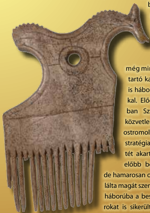
Lóabrázolásos csontfésű, Björkö lelőhelyről, Svédország

E történelmi folyamatokat a régészeti leletek is alátámasztják. Skandinávia felől már a 9. századot megelőzően érkeztek bevándorlók a Baltikumra és a Finn-öböl környékére. Itt kolóniákat alapítottak, és a helyi őslakosságot adóztatták, de össze is házasodtak velük. Tehát a Rusz valószínűleg már a kezdetektől fogva nemcsak nyelvileg és etnikailag, de régészetiileg is vegyes képet mutatott. Eredetileg lehet tehát, hogy a rusz kifejezés egy népnév volt, de később egyértelműen politikai és földrajzi elnevezés lett. A legkorábbi központjuk Óladoga volt, a mai Szentpétervár közelében. A régészeti feltárások a 8. század közepéről származó települést találtak itt. Óladoga a Finn-öböltől a Fekete-tengerig vezető útrendszer egyik kiemelkedő fontosságú pontja volt. Innen kiindulva a ruszok hódoltatták egy észak-déli tengely mentén a további stratégiai pontokat. Az Ilmeny-tónál, a későbbi Novgorod közelében Rjurikovó gorogyiscse (azaz „erődített település”) tanúskodik