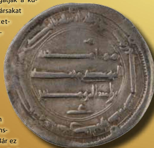
Arab feliratú ezüstérme Svédországból