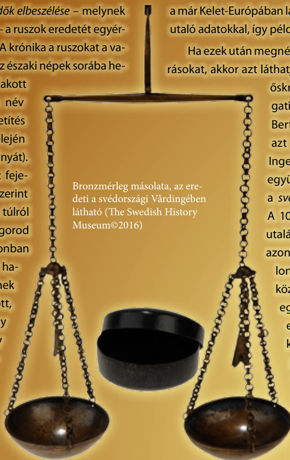
Bronzmérleg másolata, az eredeti a svédországi Värdingében látható

Kelet-európai útjaik során északi irányból dél felé hatolva elérték nemcsak a bizánciak, de az iszlám világ területeit is. Ha nem fosztogatni indultak, akkor prémekeket, rabszolgákat, kardokat és más árukat adtak cserébe selyemért és más értékes textíliáért, ezüstért, színes üvegyöngyökért és más árukért. Utazásaik során egészen Konstantinápolyig, illetve a Kaukázuson túlra is eljutottak, állítólag egészen el Bagdadig. Az élénk kapcsolatok ellenére a 9. században sem a bizánci, sem a muszlim szerzők leírásai nem adnak felvilágosítást a ruszok pontos lakóhelyéről, így a magyarokról is megemlékező muszlim Dzsajhání-féle földrajzi leírás szerint egy szigeten laktak, de hogy ez hol lehetett, azt csak találgatják a kutatók. A kortársakat megdöbbentette, amikor szinte minden előzmény nélkül 860-ban váratlanul egy egész hájjáddal érkezve ostrom alá vették Konstantinápolyt. Bár ez a támadás eredménytelen volt, mégis jelezte, hogy a Bizánci Biroda-