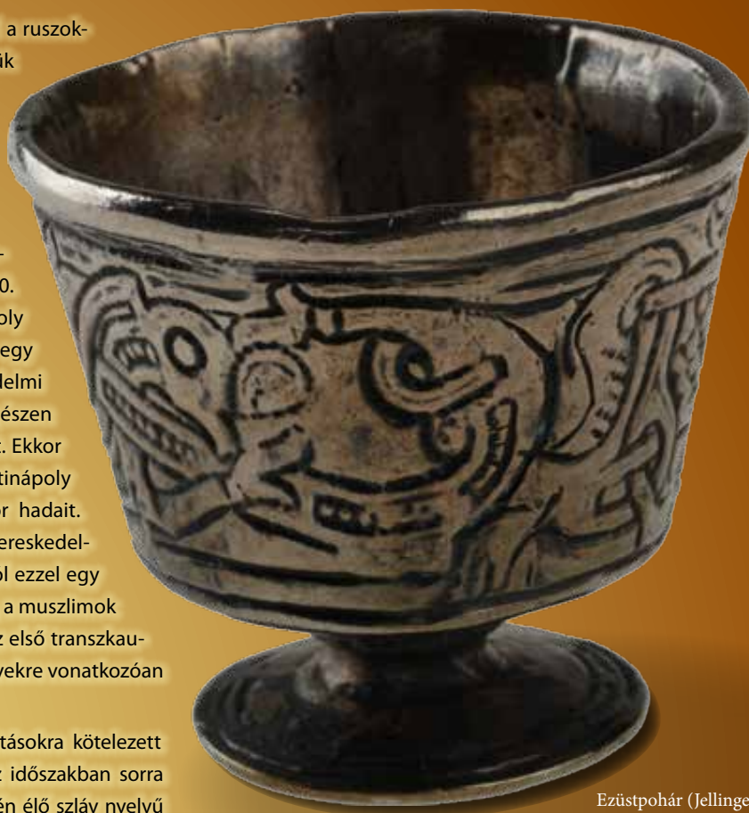
Ezüstpohár (Jellinge, Dánia)

de hamarosan ott is a bizánciakkal találta magát szemben. Bár az elhúzódo háborúba a besenyőket és a magyarokat is sikerült bevonnia, de végül mégis vereséget szenvedett. Ugyanezekben