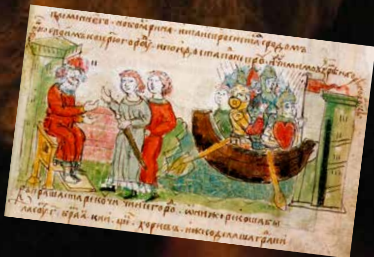
Hajóábrázolás a Radziwill-Krónikában

Ha vikingekről esik szó, az emberek többsége a Brit-szigetek vagy a mai Normandia ellen vezetett hadjárataikra, esetleg Izland, Grönland vagy mostanság Észak-Amerika általuk történt felfedezésére gondol. De az északiak nem csupán nyugat és délnyugat felé rajzottak ki Skandináviából, hanem keleti, délkeleti irányban is, ahol sorsfordító szerepet tölthettek be a Baltikum és a Kelet-európai-síkság 8–11. századi történetében. A forrásokban ekkortájt ruszok, varégok, kölpények (kolbjagok), gotlandiak és norvégok tűnnek föl. Míg az utóbbi négy elnevezés főleg a katonai kísérettel, zsoldosokkal, illetve kereskedőkkel és utazókkal kapcsolatban fordul elő, addig a ruszok a forrásokban saját fejedelmekkel rendelkező „etnikumként” jelennek meg. A legtöbbet róluk tudunk, a következőkben is elsősorban róluk lesz szó, mégpedig elsőként a rusz Rurik-dinasztia „saját” történeti hagyományáról.