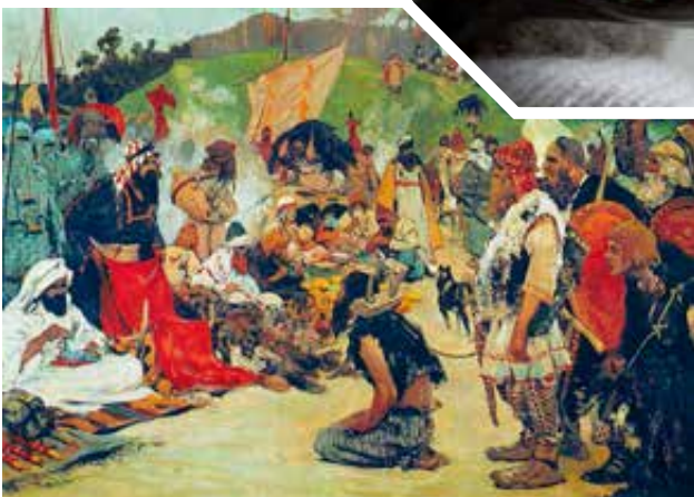
S. V. Ivanov 1909-es festménye a keleti szlávoknál zajló kereskedelmi tárgyalásokról