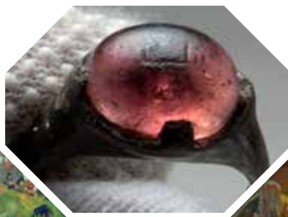
„Viking” környezetből előkerült arab felírtos gyűrű