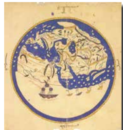
Idriszi világtérképe (a mai földrajzi látásmódnak megfelelően elforgatva)

Amikor eljött a hamvasztás napja, egy hajót a partra vontattak és állványra tették azt. Az így kiemelt hajót berendezték: ágyat hoztak brokátmatra-