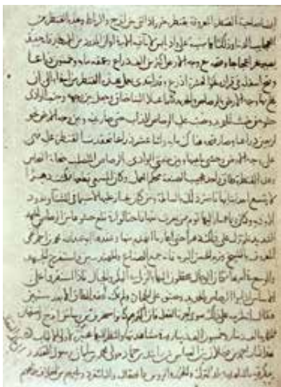
Egy oldal Ibn Fadlán művének kéziratából