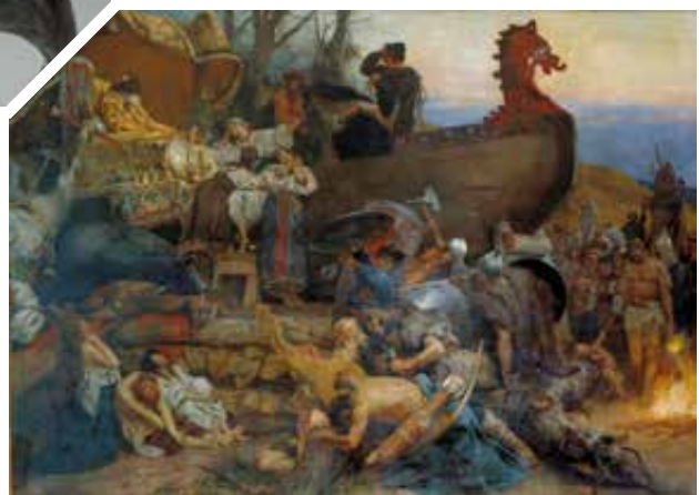
H. Siemiradzki festménye a rusz vezér temetéséről (1883)