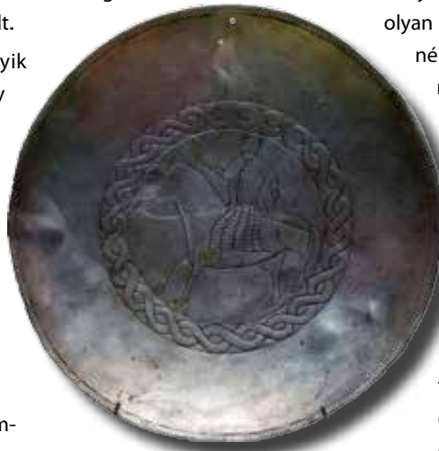
Lovast ábrázoló ezüsttál Kelet-Európából

Tehát nagyon valószínű, hogy az Ibn Fadlász által leírt halotti szertartásban a Skandináviából hozott viking elemek és a Kelet-Európában élő török és finnugor nyelvű népek halottas szokásai ötvöződtek, s mindezt Ibn Fadlász a saját muszlim világképének szűrőjén keresztül tudta csak értelmezni.