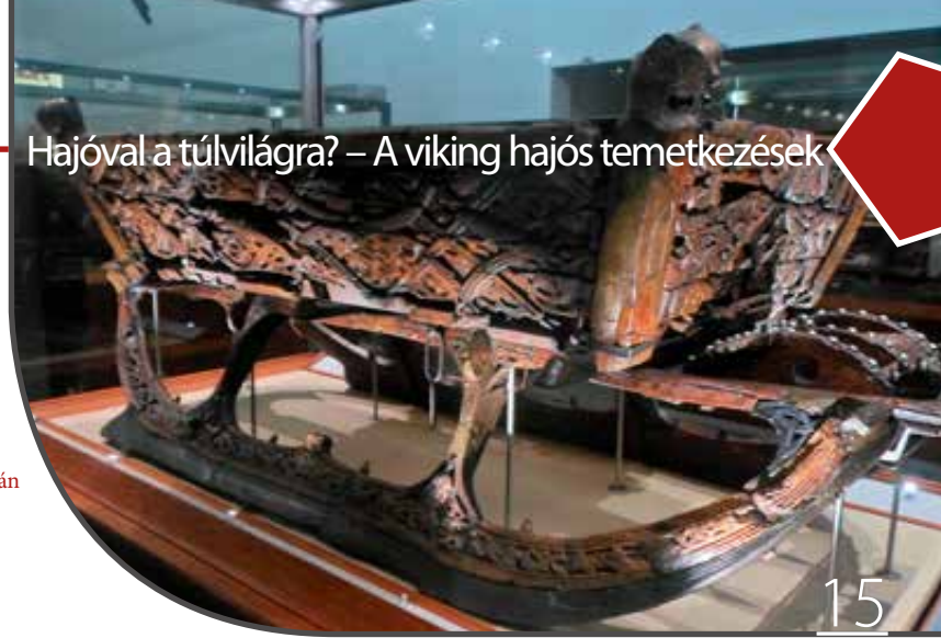
Az osebergi szán

szerint ez a lelet egy hajó volt, amiről Gustafson a helyszínre utazva meg is győződhetett. Az ásatásra azonban csak a következő évben került sor. Három hónap alatt sikerült a felszínre hozni teljes egészében a hajót, de a restaurálása összesen további 21 évet vett igénybe. A hosszadalmas folyamat oka az volt, hogy a restaurátorok igyekeztek minden eredeti darabot a legjobb állapotban megőrizni és felhasználni, így a múzeumban ma őrzött hajó 90%-ban valóban az eredeti faanyagából áll, s így a legépebbnek számító eredeti viking hajóról van szó.