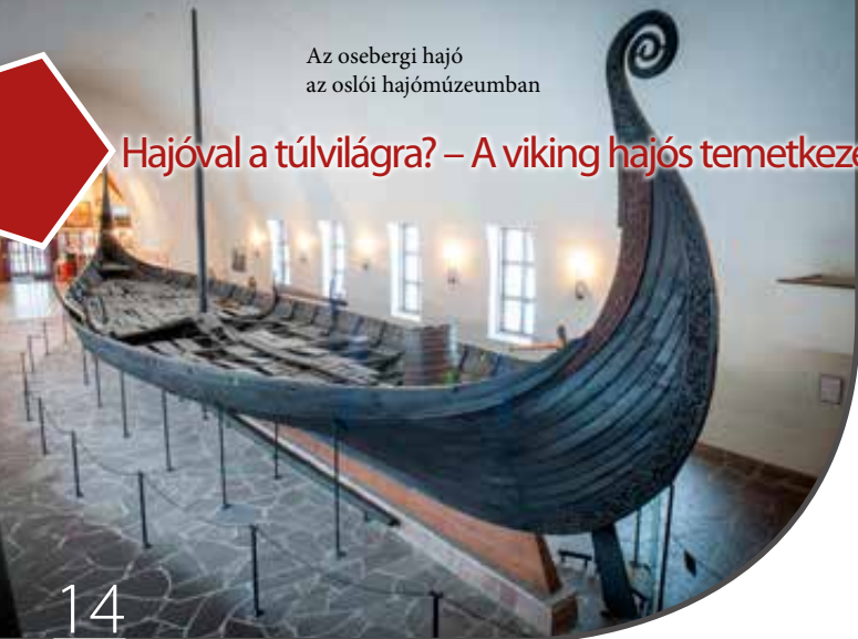
Az osebergi hajó az oslói hajómúzeumban