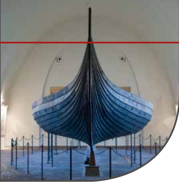
Kecses ívek és vonalak