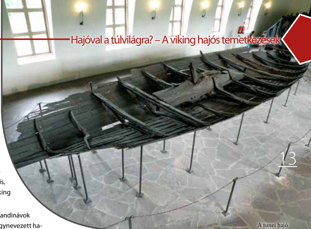
A tunei hajó

Azt azonban ezen nehézségek ellenére is tudjuk, hogy a hajó közepén állt egykor a halott számára készült kamra. Feltehetően elég módos lehetett az ide helyezett férfi, akinek