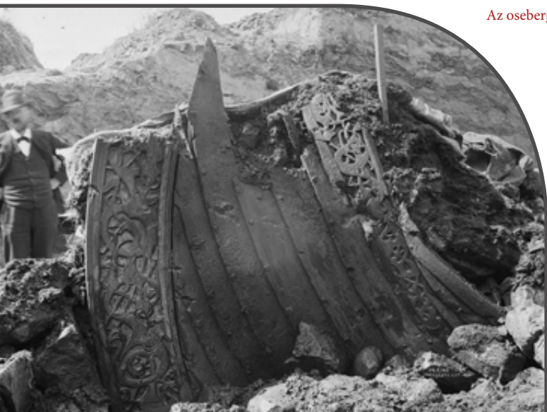
Az osebergi hajó feltárása