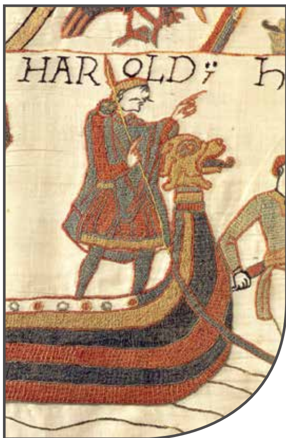
A bayeux-i faliszőnyeg egyik részlete

ga megölését hosszas procedúra előzte meg, melynek során feláldozott egy tyúkot, majd pedig a halott rokonaival közösült. Azután a „Halál Angyala” kötéllel megfojtotta. Kíáltásait a felsorakozott harcosok pajzsaik és kardjaik összecsapkodásával fojtották el. Végül pedig a halott legközelebbi férfi rokona meztelenül, egy fáklyával a kezében meggyújtotta a máglyát. A hajót háttal közelítette meg, egyik kezével eltakarva ánusztát – valószínűleg a szellemek ellen védekezett így. A tűz elhamvadása után a hajó fölé dombot emeltek.