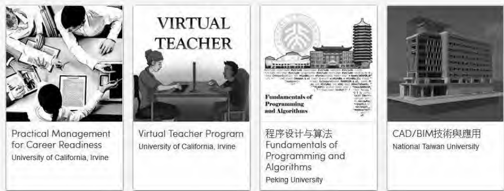
3. ábra. Példa a Courserán található szakterületi képzésekre

A Coursera másik fizetős újítása a szakterületi képzések, amelyek előre összeállított kurzuscsoomagokat, záróvizsgát és sikeres elvégzésük esetén szakterületi bizonyítványt takarnak (3. ábra). Jelenleg közel harminc képzés érhető el, amelyek díjszabása kurzusonként nagyjából 30–50 vagy képzésenként 245–300 dollár. Az oldal leírása szerint ezek a képzések elsősorban a keresett szakképesítéseket célozzák meg, és ezért a listán olyan kurzusok szerepelnek, mint adatfeldolgozás, digitális marketing, felhőalapú számítástechnika vagy elektronikus oktatás. Fontos megjegyezni, hogy a képzések ingyenesen is elvégezhetők a Courserán , de csak akkor számítanak bele a szakterületi képzések programba, ha valamennyi szükséges kurzusnál hitelesített bizonyítványt szereztünk. Ebben az esetben az oldal a korábban befizetett díjakat levonja a képzés összköltségéből. Van lehetőség arra is, hogy anyagi támogatásra pályázzunk, amennyiben bizonyítani tudjuk rászorultságunkat.