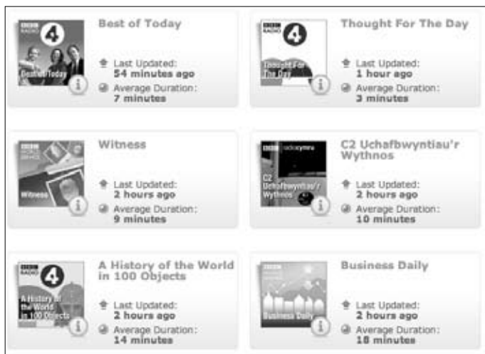
3. ábra: A BBC epizódjai

lókát figyelembe véve alakították ki. A Talk About English 20 perces epizódjai a mindennapos nyelvhasználat szókincsének és nyelvtanának gyakorlásában segítenek; a 6 Minute English rövidebb adásai egy-egy témát járnak körül hat percben; az Academic Listening pedig kifejezetten angol nyelvterületen tanuló külföldi egyetemistáknak készült.