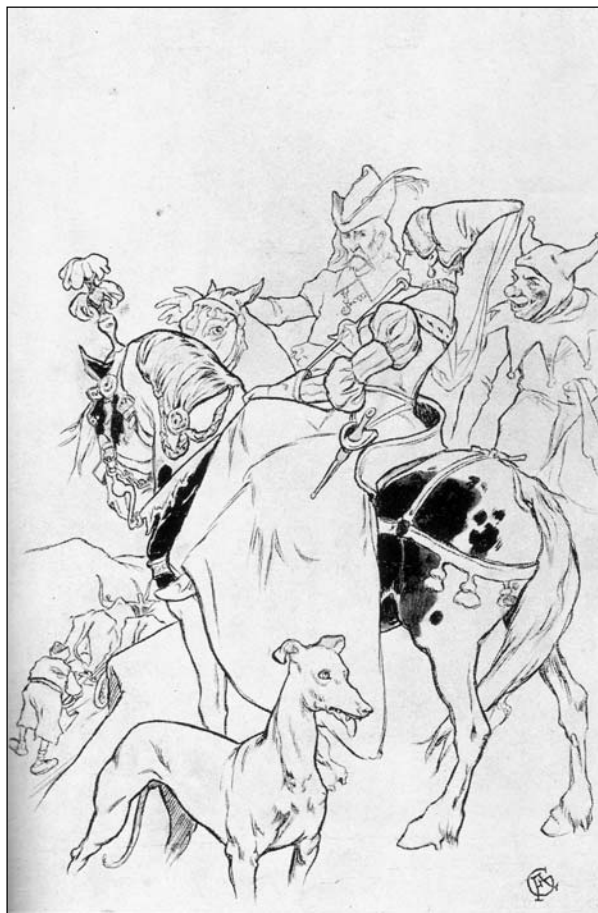
Az udvari bolond

Igaza is lenne. Egy diák ne nézze soha bolondnak a tanárt.