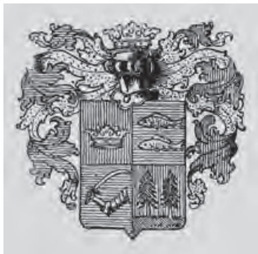
A Gorzó család címere

1945 után íródott életrajzában nemesi származását az anyai ősökkel a politikus Madarász Józseffel és Madarász Lászlóval vagy Madarász Viktor fes-