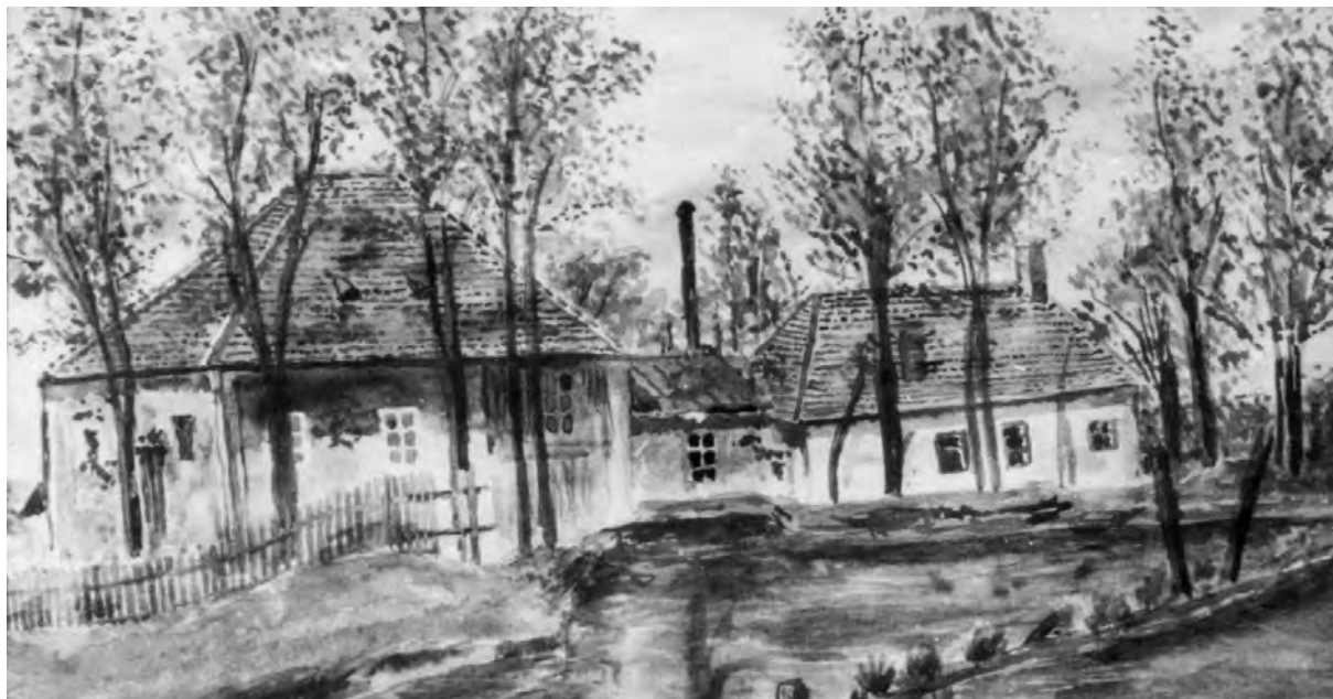
A malom és a molnárlakás. Florián János: Palotai táj című festmény részlete 1924-ből.

A XVIII. század közepe táján keletkezett források egyetlen malomról szólnak. A falu XVIII. századi birtokosának, az Ujfalussy családnak az