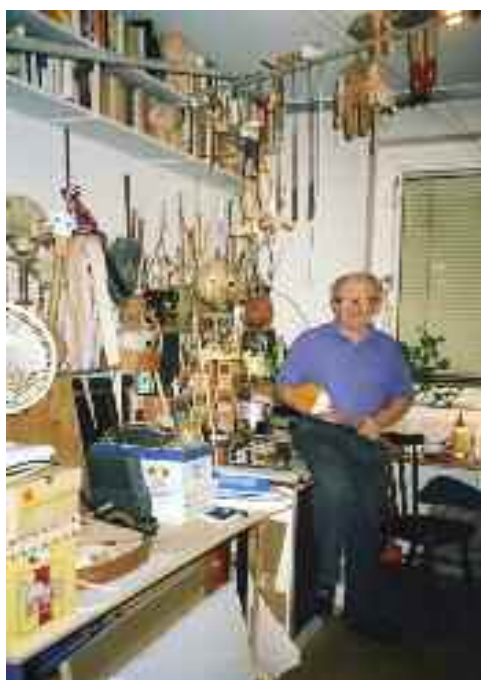
A műhelyben, otthon