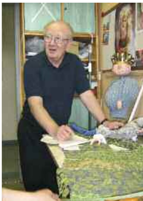
A Harlekin Bábszínház műhelyében, 2010.