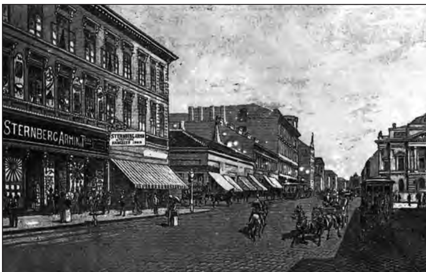
A Rákóczi úti üzlet