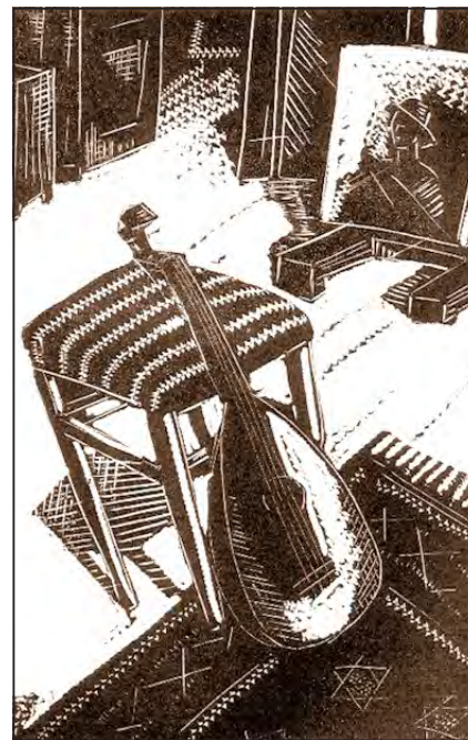
Walleshausen Zsigmond: Interieur (1931)

Egyiküknek sem maradt az itteni műtermet ábrázoló alkotása, hacsak Walleshausen egy ólomba metszett műtermi csendélete nem itt készült 1931-ben. Ő éppen abban