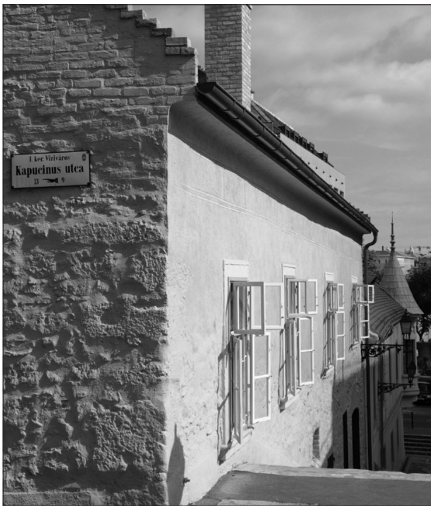
A rekonstrukció egy egész terület hangulatát erősíti fontos sarokponton