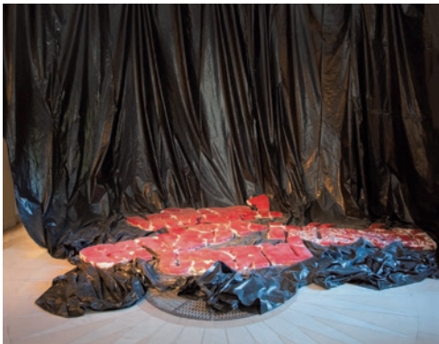
CSONTÓ LAJOS Kidobott szavak, 2012, installáció, részlet, Et lettera – Képeket írni, szavakat rajzolni , Déri Múzeum, Debrecen, 2012