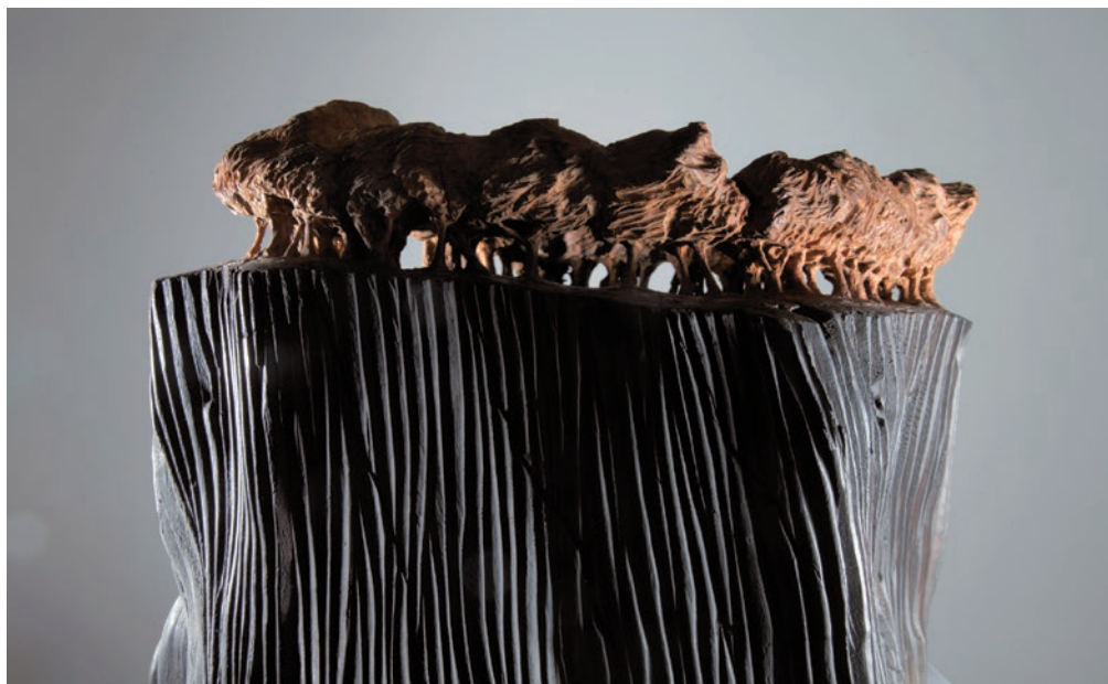
Erdő, szél, 2012, cseresznyefa, 29 × 33 × 36 cm, Molnár Ani Galéria