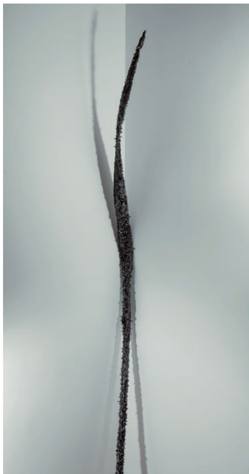
GÁLHIDY PÉTER Kiskapus, 2012, vegyes technika, 240 x 20 x 14 cm, Molnár Ani Galéria

tanításokban a nem cselekvés szimbólumaként jelenik meg –, különféle forma-, felületalakítással és általában emberragyságnál nagyobb méretben, visszatérő elemként jelenik meg. 5 Ez az egyszerű növény a téri dimenziót tekintve is – csavarodva, kilapítva vagy éppen meghajolva – kihívásokat rejtő szobrászi alapanyag.