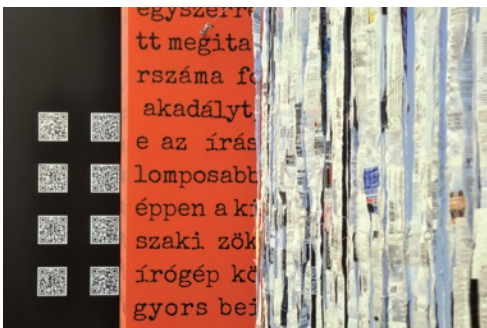
BENCZÜR ÉMESE Használati utasítás, 2012, részlet, vegyes technika, Et lettera – Képeket írni, szavakat rajzolni , Déri Múzeum, Debrecen, 2012

kívül kézzelfogható jelei is megmutatkoztak a kiállítás megnyitásokor. 8