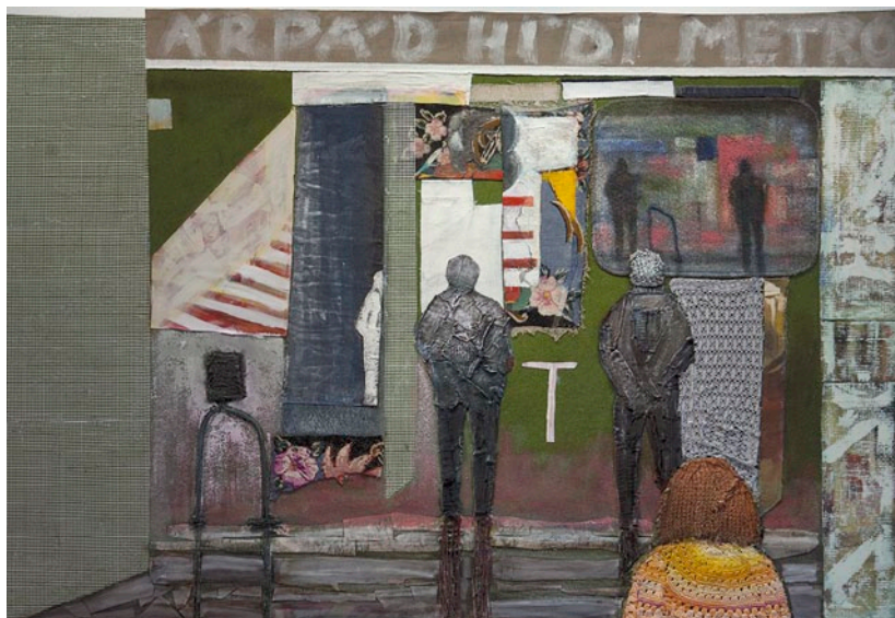
BÁCS EMESE Árpád hídi metró, 2011-12, textilkollázs, festmény szőnyegen, 132×200 cm

Egy idősebb képzőművész kategorizálta egyszer úgy a képző-és iparművészetet, hogy a kép(zőművészet) az, amit a falra teszel, iparművészet az, amit használsz, például amin jársz, ezért a gobelin, az bizony mindkettő. Nyilvánvaló, hogy az efféle definíciók ritkán megingathatatlanok. BÁCS EMESE képzőművész