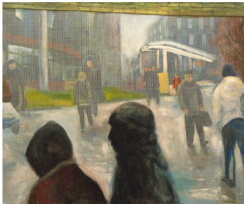
BÁCS EMESE Moszkva tér, 2011, olaj, kollázs, vászon, háló, 100 × 120 cm

gal, nagy méretben beírt-befirkált monogramja és személyes dátumai, tömör megjegyzései, hanem festői temperamentuma, a történések, emberi játszmák közelébe férkőzése vagy azok nyomában rohanása is közvetítik átélő személyiségét. Keserédesen, de ugyanakkor szkepszt és felelősségérzetet sugallva tudósít rólunk, a magunk teremtette, csillogásában is esendő és hazug rendszerről, a sokszor állatkertszerű emberkertről.