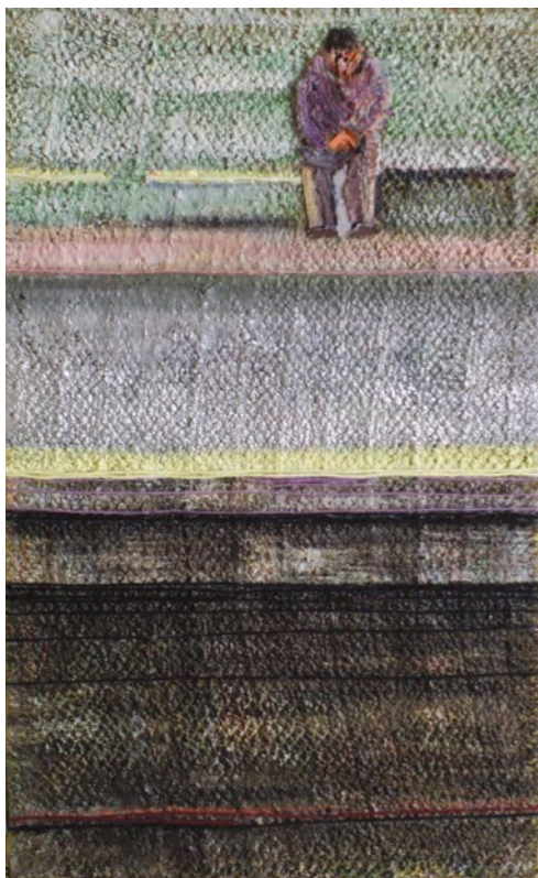
BÁCS EMESE Várakozó, 2011, olaj, textilkollázs, 73 × 45 cm

ményekről, tömegközlekedésről, bevásárlásról, a nagyvárosi létről vagy inkább életről. Utca-képei, városrészei, köztük játszótér-részletekkel mind a mi – hol komikus, hol tragikus – játszó-terünket ragadja meg, sokszor lomtalanított anyagokra, azok asszociatív üzenetértékét hangsúlyozva, arra rájátszva. Nyers színek, gesztusok és azokat sokszor minden tekintetben felülíró rusztikus anyagok applikációi, gyakran felületesen, jelzésszerűen vagy éppen infantilisán odavetett részletek, információs piktogramok, táblák dzsungelének ironikus, közönyös képi idézgetése.