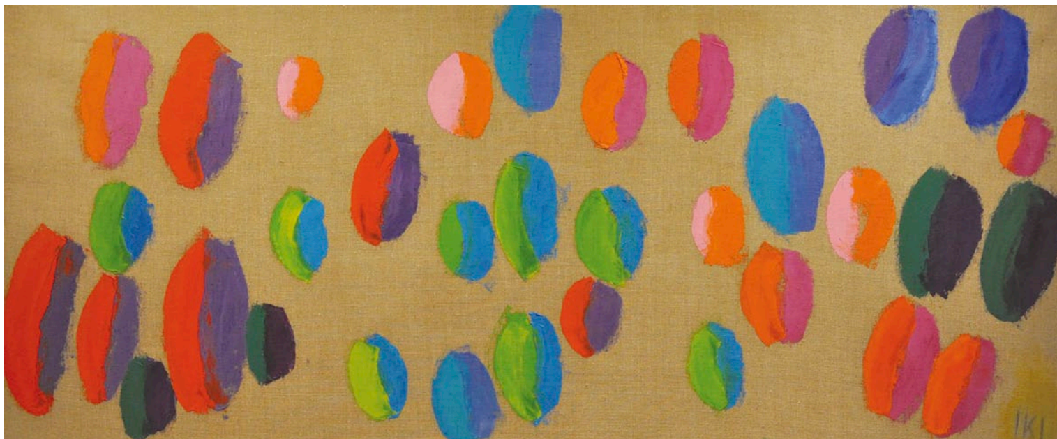
ILONA KESERÜ ILLONA Színváltó hangtestek, 2010, olaj, vásznon, 60 x 150 cm

ten érhetők a Keserúnél rendszerint visszatérő plaszticitás, tériség és kultúrtörténeti párhuzamok műalkotás-reflexiói.