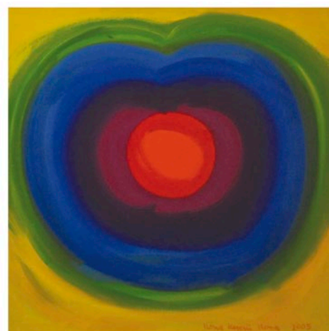
ILONA KESERŰ ILONA Színváltó elemzés, 2005, olaj, vászon, 70 x 70 cm