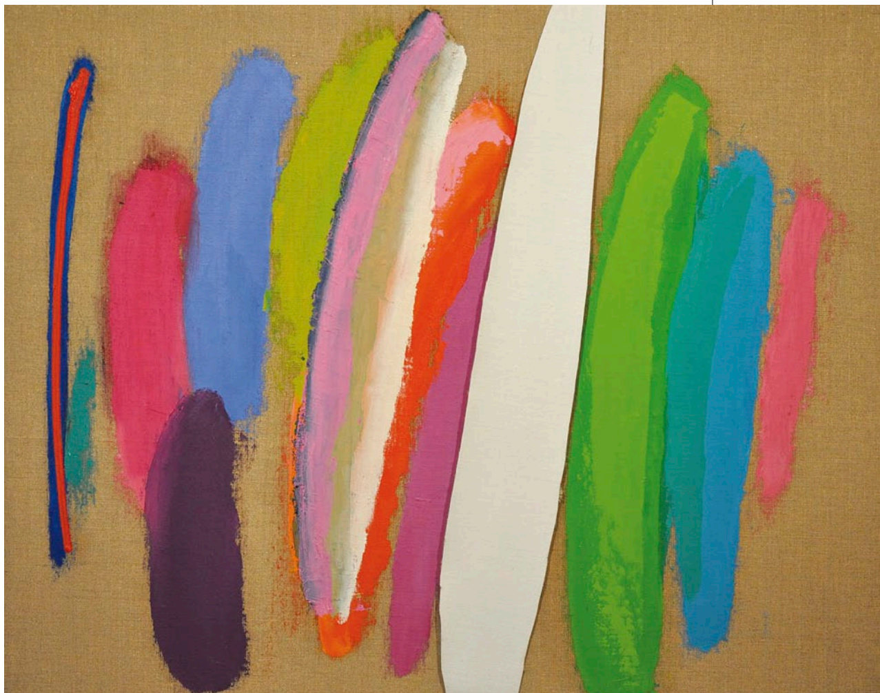
ILONA KESERÜ ILONA Hangok, 2009, olaj, vászon, 63 x 80 cm