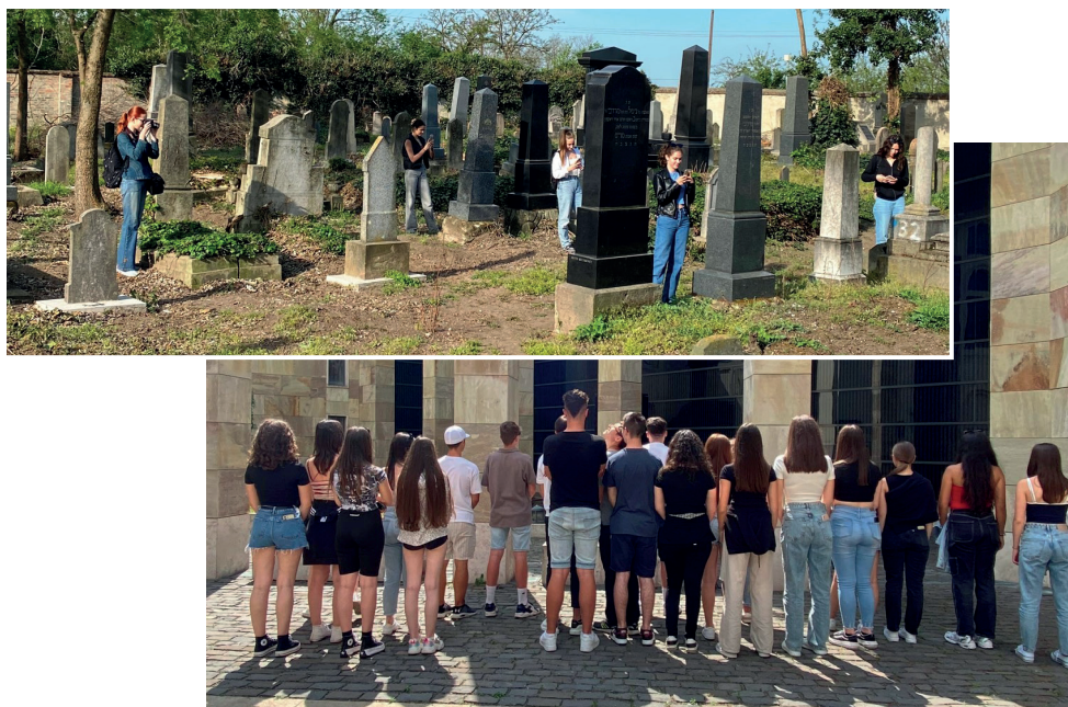
Látogatás a Holokauszt Emlékközpontban

Az izraelita temető sírjainak feliratait is rögzítettük