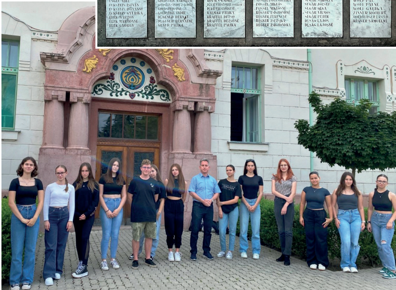
A projektben részt vevő diákok egy csoportja a gimnázium épülete előtt