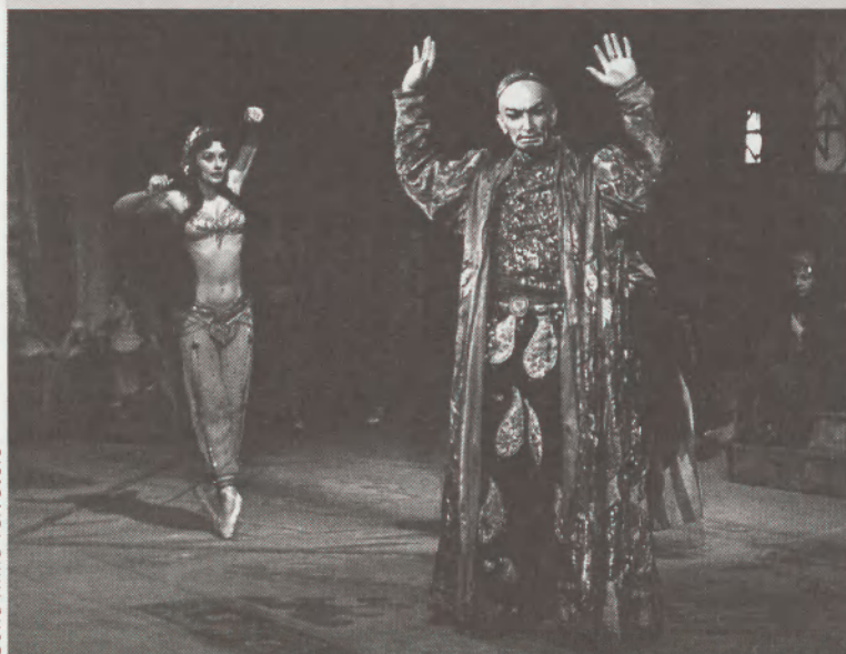
A bahcsiszeráji szökőkút 1952