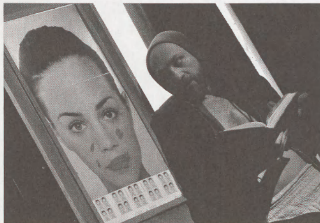
Lopott arcok könyve (Dimitri Színművészeti Iskola)

Sempre libera -áriájába, mellyel igencsak érzékletesen (és persze kellő nevetető bohóckodással) felveti az örök elkötelezettség és a szabad élet kettősségét. A Lopott arcok könyve – a kortárs abszurd és groteszk, „mutatványos” jeleneteiben – számos jól átgondolt, inyeneknek való finom utalást is tartalmaz.