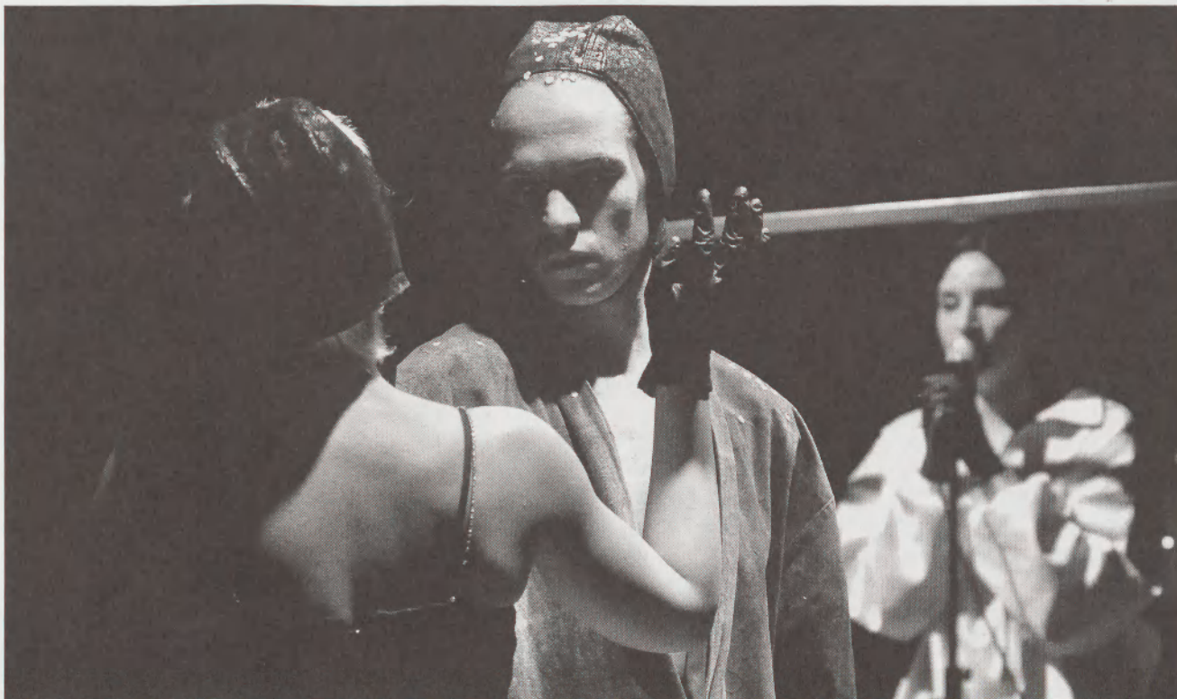
A kastély (ArtEZ Színművészeti Akadémia)

Az SZEM idén is sokszínű volt: a két pólusán tematikájukban egymástól határozottan eltérő előadásokat láthattunk, de akadt néhány olyan is, amelyen éppen a két véglet közötti termékeny átmenetiség volt megfigyelhető. A bukaresti és a varsói hallgatók stúdiumprezentációkat hoztak, melyek elődásszerűen összefűzött helyzetgyakorlatokból álltak, míg a kaposváriak és a budapestiek készre érlelt előadásokkal léptek fel. A kettő közötti – metodikailag izgalmas – átmenetnek gondolom a verscói (Svájc) és az amszterdami–arnheimi ifjú színművészek produkcióját.