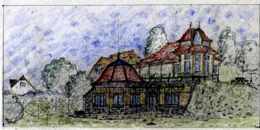
Mújdricza Ferenc: Látványterv a hegyek felé

„Azért vagyunk a világon, hogy valahol otthon legyünk benne” – írta Tamási Áron, erdélyi író, aki valószínűleg a szó tágabb értelmében gondolt az otthonra, de talán értelmezhetjük ezt a szállóigévé vált mondatot szorosabban is, a közvetlen lakóhelyre, a házra szűkítve. A ház, amit egyelőre építési módjától függetlenül, az embernek menedéket, biztonságot, meleget adó lakhelyként értelmezünk, kultúrtörténeti tényezőként jelent meg a történelemben. Őseink ezeréves építészete a jövő építészetét szolgálhatná. Az ősi kultúrák sokkal közvetlenebb kapcsolatban álltak a természettel, a Nappal, a földdel, az éggel és az évszakok változásával. Erre tett kísérletet az építész, amikor a család igényeit figyelembe véve, a Duna felé lejtő terepen olyan, nagyrészt sziklakertes terasszal fedett földalatti helyiségeket hozott létre, amelyhez egy négy méter átmérőjű, kupolás épületrész kapcsolódik. A tervezésnél ügyeltek arra, hogy az épület ablakai a Bazilika panorámájára nézzenek. A nap folyamán, a fény szabadon beárad a lakás központi helyiségébe, amely a kert felé három oldalon is nyitott.