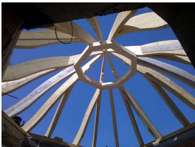
Kupolaváz bentről

bújtassák. Gondoljunk a barlanglakásokra, amelyek nem a természet hozott létre, hanem az ember vájta ki a hegyoldalból. Ebben az esetben ökológiai és takarékosági szempontok vezették a tervezőt. Az épületet körülvevő föld egyszerre tartálya és védelmezője a növényeknek, természetes hang- és hőszigetelő képességgel rendelkezik. A lakás fenntartása alacsony költségekkel jár. Az idős nagyszülők számára minden évszakban közel egyenletes hőmérsékletű teret biztosít: nyáron kellemesen hűvös, a téli hidegebb éjszakák során pedig a föld melegét is felhasználja, így takarékos. Ebben a lakrészben a hálószobát helyezték el. A már meglévő lakóépület tornáca és az új Jurta-barlang sziklakertje a család és vendégei számára egy árnyas, kiülő helyet biztosító szőlő- és rózsalugassal fog kiteljesedni, így kertészeti eszközökkel is szerves egységbe foglalja a létesítményeket.