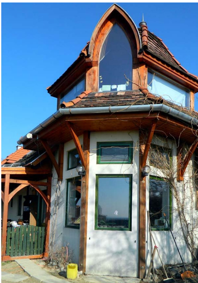
A felső rész

Az ókori irodalomban számtalanszor felidéztek és újraírták az emberiség boldog, gondtalan korszakának, az aranykornak a mítoszát. Az építész felelőssége, hogy a legkisebb családi háztól kezdve, minden munkájában egészséges, a környezetbe harmonikusan illeszkedő épületet alkosson. Ezeket olyan étellel kell megtölteni, ami az összetartást, az összetartozást erősíti, és ha lehet, ebben a sokszor beteges világban gyógyító erőt sugároz az emberek felé. Ha ezeket az elveket tarjuk szem előtt – ahogy tette Mújdricza Ferenc is – közelebb kerülhetünk egy újabb aranykorhoz. Első fővárosunk dicső múltjának megfelelően az aranykort idéző alkotásokkal szabad csak gazdagítanunk Esztergomot.