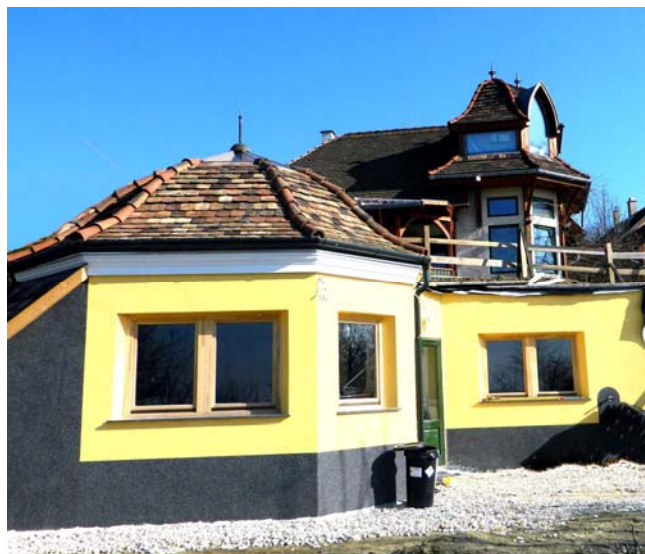
A megvalósult épület