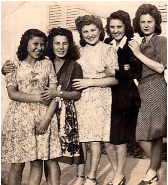
Szobatársaimmal a híradós kiképzésen, Szászrégen, 1943