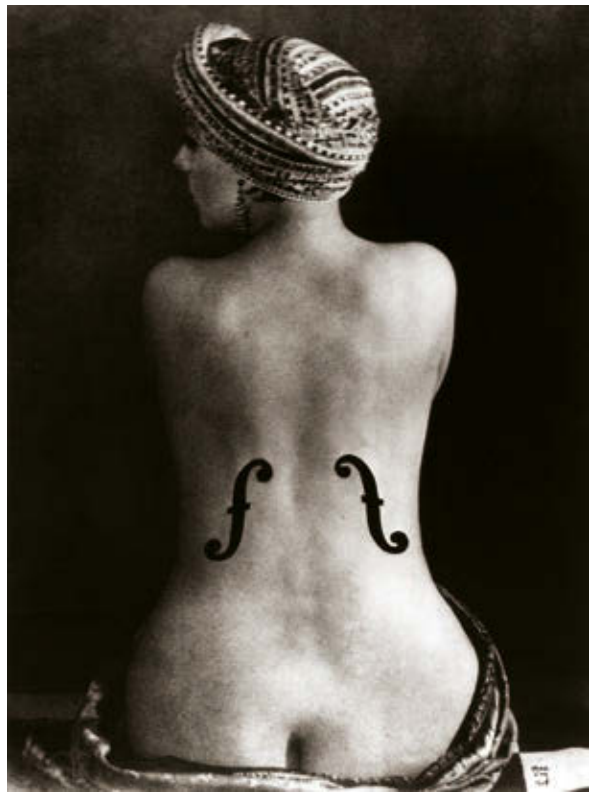
MAN RAY: Ingres hegedűje , 1924 (1990)

Courtesy Galerie Johannes Faber, © MAN RAY TRUST / Bildrecht, Wien, 2017/18 HUNGART © 2018