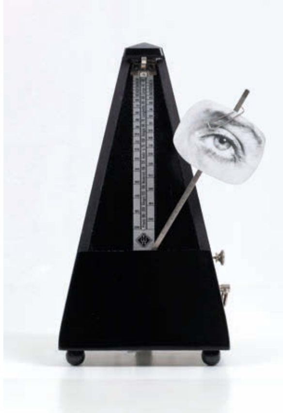
MAN RAY: Le rombolandó tárgy , 1923/65 metronóm, fotó, gemkapocs

A Montparnasse királynője, Kiki után az amerikai Lee Miller lett Ray élettársa, modellje és aktív munkatársa, közösen fejlesztették ki például a szolarizációs eljárást. A ma már a legtöbb mobiltelefonba beépített applikáció grafikává alakítja a fotót. Munka közben Ray állítólag szeretett metronómot hallgatni. Ki is