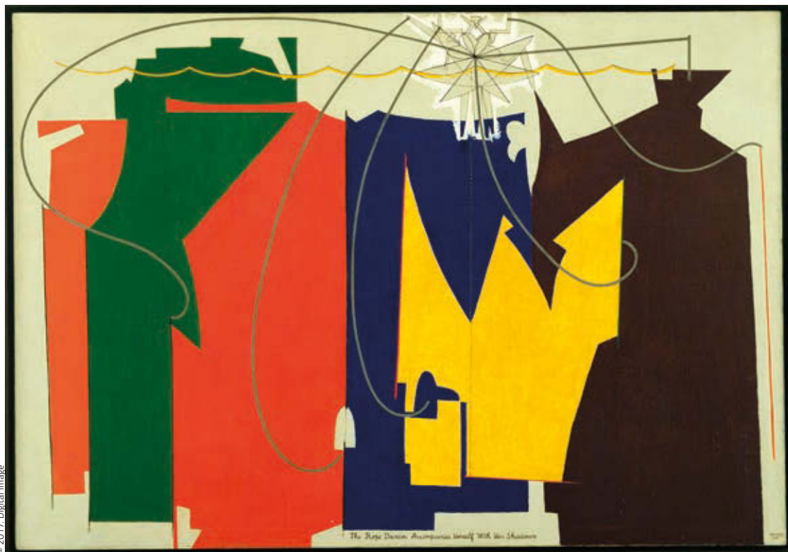
MAN RAY: A kötél-táncost saját árnyéka kíséri , 1916, olaj, vászon

Museum Abteiberg Mönchengladbach, © MAN RAY TRUST/Bildrecht, Wien, 2017/18 HUNGART © 2018