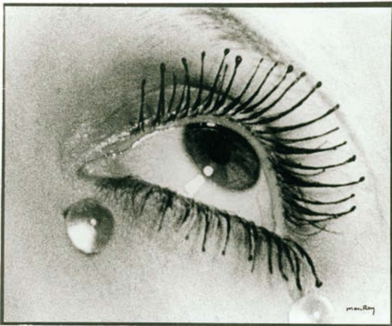
MAN RAY: Könnyek , 1933 (1959), ezüstszelatin

1926-ban Jean Cocteau megkérte Man Rayt, hogy készítsen fotósorozatot egy férfi artistáról, amikor nővé alakítja át magát. Abban az évben egész Párizst lázba hozta Barbettes, a selyemharisnyás, strucctollakkal ékesített, túllszoknyás akrobatanő, aki kötélén táncolt a magasban, és lélegzetelállító mutatványokat végzett a trapézban. A szám végén, amikor Barbettes meghajolt a közönség előtt, ugyanazzal a mozdulattal vette le a fejről a parókát, hogy láthassák, valójában nem nő, hanem férfi. Ray mehökkentető fotósorozattal dokumentálja, hogyan sminkeli magát femininné egy