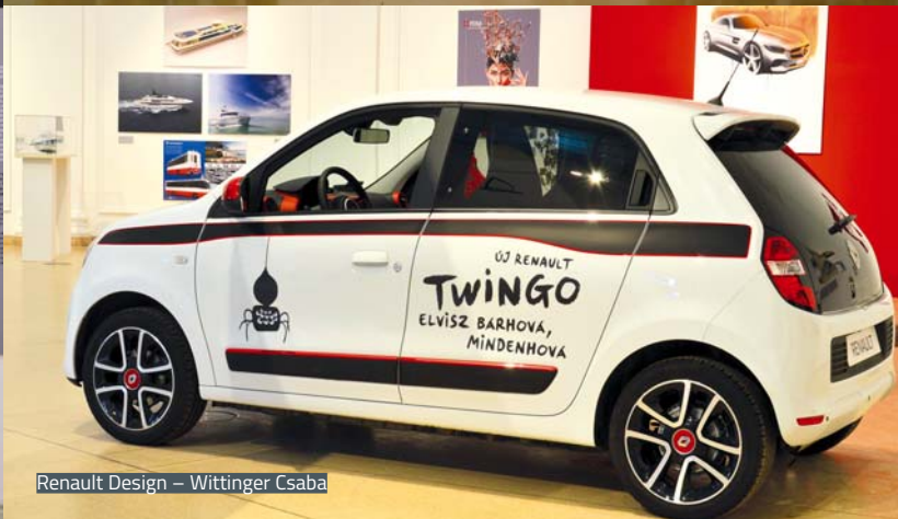
Renault Design – Wittinger Csaba