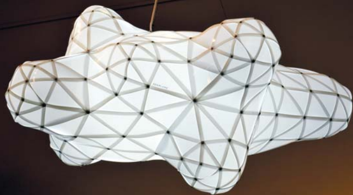
Juhász Ádám: Cloud Light 125, 2015, az ADAMLAMP terméke