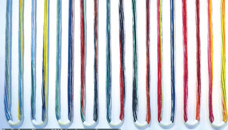
Regős Anna: Flumen, 2012, lervászón, műanyag cső