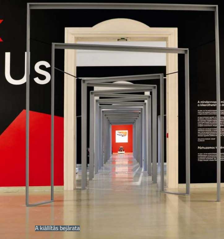
A kiállítás bejárata